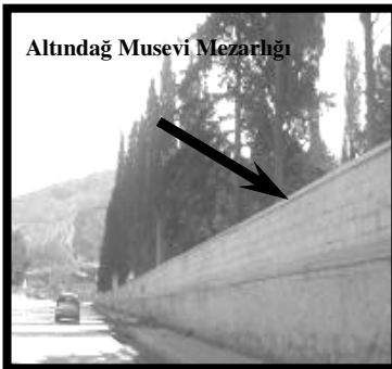
Resim 7 (Altındağ)