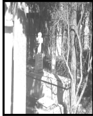
Resim 12(Kokluca Rum)