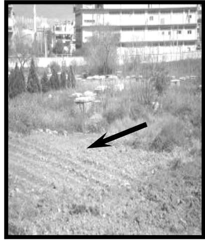
Resim 4 (Gürçeşme)

Gürçeşme Musevi Mezarlığı, gömü yapılmamasına karşın yukarıda belirtildiği gibi ünlü kişilerin mezarları bulunması ve mezarlık içinde akan ve kutsal kabul edilen su nedeniyle Bornova Yahudi Mezarlığı’na (Resim 9) göre daha bakımlıdır ve sürekli bekçisi bulunmaktadır.