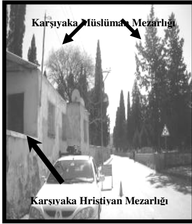
Resim 1 (Karşıyaka)