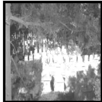
Resim 8 (Altındağ)