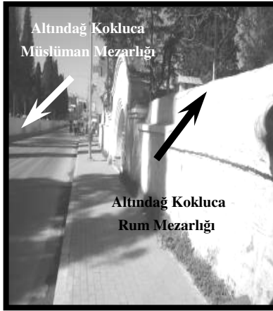
Resim 11(Kokluca Rum)