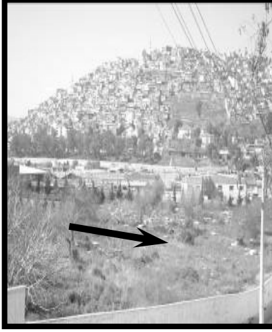
Resim 3 (Gürçeşme)