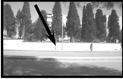
Resim 9 (Bornova Yahudi Mezarlığı)

Bornova Yahudi Mezarlığı 40 , Bornova İngiliz Mezarlığı'nın karşında yer almaktadır. Eskiden civarında Müslüman mezarlığın da bulunduğu bilinmektedir. Altındağ Musevi Mezarlığı'nın açılmasıyla birlikte 1934 yılında gömüye kapatılan Bornova Yahudi Mezarlığı Ege Üniversitesi Hastanesi Kavşağı'na çok yakın bir mesafede ve kentin oldukça işlek bir kısmında kalmıştır. Mezarlığa gömü yapılmadığı için sürekli bir bekçisi bulunmamakta ve Bornova Altındağ Musevi Mezarlığı bekçisi bu mezarlıkla da ilgilenmektedir. Bu nedenle de özellikle geceleri Bornova Yahudi Mezarlığı'na hukuka aykırı olarak girildiği söylenmektedir.