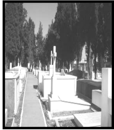
Resim 6 (Paşaköprü)