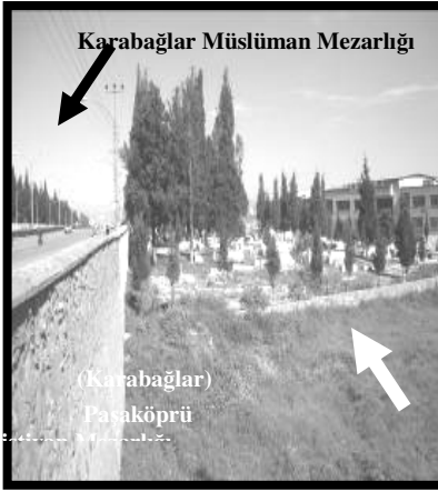
Resim 5 (Paşaköprü)