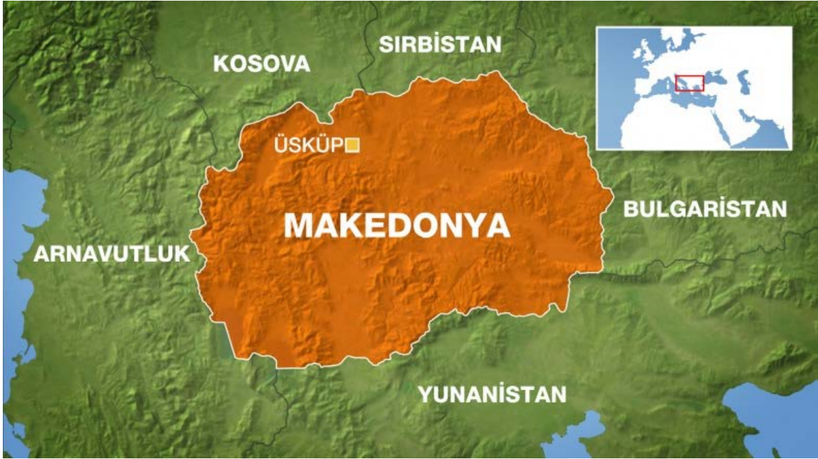
řekil 1. Kuzey Makedonya haritası

Machiel Kiel, tahrir defterlerine dayanarak İřtip nufusu ile ilgili verdiđi bilgilerde 16. yuzyıla dođru Mufsluman nufusun arttıđını soylemiřtir. 2002 Nufus Sayımlarına gore nufusu 43.652 bine ulařmıřtır.