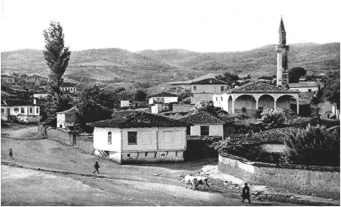
Şekil 2. İştîp'ten bir görünüm 18

İştîp, Yugoslavya'nın dağılmasından sonra ise 1991'de bağımsızlığını ilan eden ve şimdiki adı Kuzey Makedonya devletine bağlı bir şehirdir.