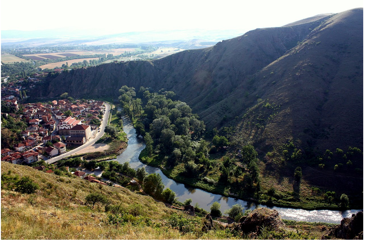
Şekil 3. Bregalnica Nehri ve Novo Selo Köyü'nden bir görüntü 257

Nazırzâde Mehmed Ağa'nın yirmi sekiz adet çiftliğinin tamamının idaresi ortakçılar tarafından yürütülmekteydi. Bu sebepten âyânın mallarının satılması mümkün değildi. Ölümünden sonra evlatları ve nikahlı eşleriyle birlikte 27 adamının üzerlerinde sadece elbiseleri ile kaldığı, hallerinin perişan oluşlarına merhamet edilmesiyle var olan emlak, hububat, hayvanların kendilerine verilmesi konusu Rumeli Valisi Abdullah Ağa tarafından İstanbul'a bildirilmiştir.