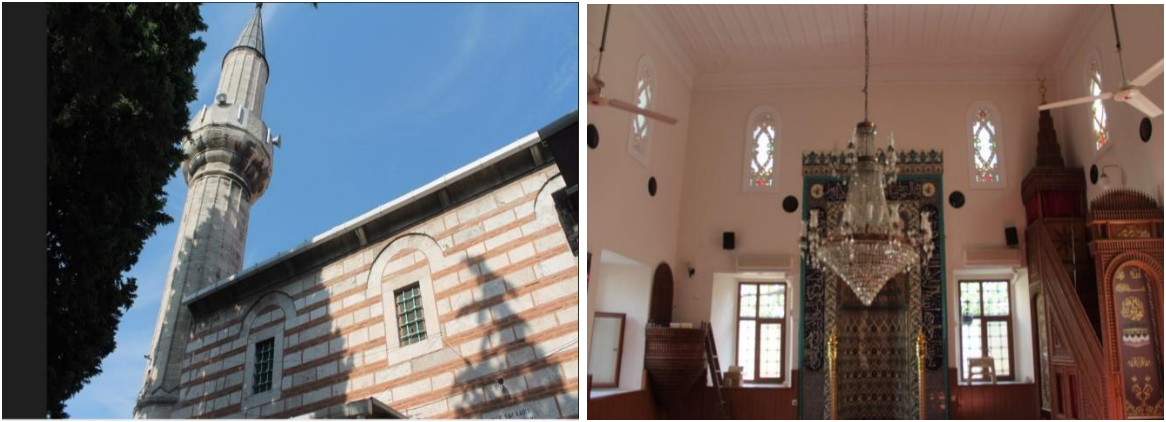
Şekil 6. Edirnekapı'daki Hatice Sultan / Adilşah Kadın Cami (Sena Sezen Özen Alabaş, Eylül 2021, İstanbul).

1942-1943 yılları arasında ise tamamen ortadan kalkmış ve bir süre daha bu halde kalmıştır. Mektebi ise 1946 senesinde yıkılmıştır. Ayvansarayî Hüseyin Efendi'nin Hadikatü'l Cevâmi isim eserinde cami hakkında bilgiler yer almıştır (Eyice, 1981: 135-147). Ardından yeniden inşa süreci başlamıştır. Günümüzdeki hali de tamamen yıkıldıktan sonra yapılan yeni halidir. Kitabesinde, 1975'te tamir edilmeye başlandığı ve 1977 yılında da aslına uygun olarak yeniden inşa edildiği yazmaktadır. İşleyişini hala sürdürmekte ve bakımlı bir görünüme sahiptir. Tarihinde, pek çok kez harap olmuş ve defalarca yeniden inşa edilmesi gerekmiştir.