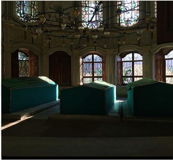
Şekil 1: Şah Sultan Külliyesi, türbenin iç görünümü, sokak ve bahçe çeşmeleri (Sena Sezen Özen Alabaş, 2021, Eyüpsultan/İSTANBUL).