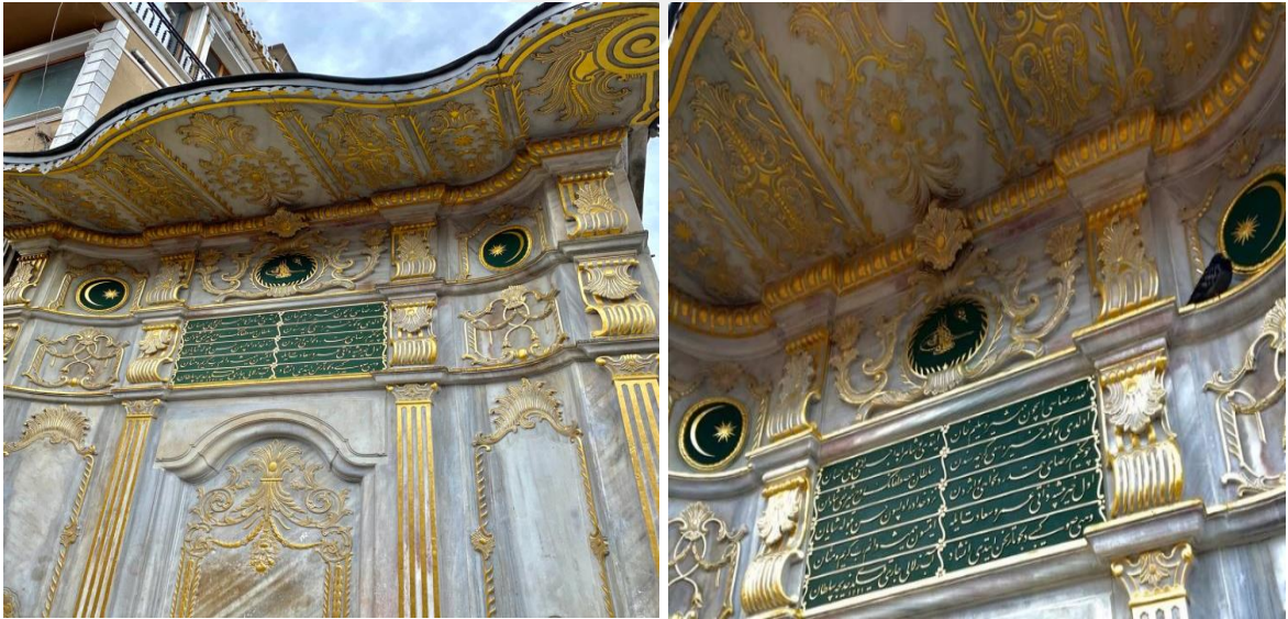
Şekil 7. Hatice Sultan'ın Eminönü Mısır Çarşısı girişindeki çeşmesi ve kitabesi (Sena Sezen Özen, Eylül 2021, İstanbul).

Kendisinin bu çeşmeyi Allah'ın rızasını kazanmak ve ölen babası Sultan Mustafa'nın ruhu için yaptırmış olduğu kitabede vurgulanmıştır. Hatice Sultan'ın ömrünün saadet içerisinde geçmesi için de dileklerde bulunulmuştur. Çeşmeden akan suyun ise tatlı, nadir bir su olduğu belirtilerek övgü amacıyla mübalağa yapılmıştır. Çeşmenin kitabesi ise dönemin ünlü şairi Vehbi tarafından, ölümünden yaklaşık üç sene önce, 1806 senesinde yazılmıştır 66 (Egemen, 1993: 365; Kuru, 2010: 140-141). Nitekim çeşmenin yapımı da bu yıl tamamlanmıştı. Çeşmenin inşa izni ise vakfının mütevellî heyetinden alınmıştı. Kagir ve taş malzeme kullanılmış, dayanıklı olmasına özen gösterilmişti. Masrafları da vakfına bağlı mülklerinden karşıladı. Aynı zamanda annesi Adilşah Kadınefendi'nin vakfından 3.314 kuruş aldı. Mukataası olan Androsa kazasından 19 çiftliğin mahsulünden senelik 2.000 kuruşu, çeşmenin hizmetleri için ayırdı. Hatice Sultan çeşmenin arsası için Kaptan-ı Derya Hayrettin Paşa vakfına senelik 300 akçe vermeye başladı. Çeşmeye gelecek suyu da Eyüp'teki büyük Kırkçeşme su tesislerinden tedarik etti. Çeşme tasını da 12 akçe yevmiyeyle bir görevliye zimmetledi. Bu görevli çeşmenin tasını gece alacak, gündüz yerine koyacak ve taşı muhafaza edecekti (VGM. 0055.1446. 50-64).