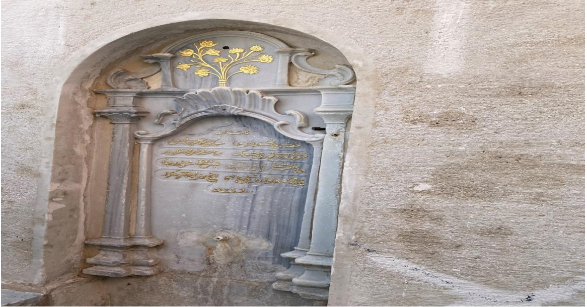
Şekil 5. Kuruçeşme Beyhan Sultan Çeşmesi (Sena Sezen Özen Alabaş, 2021, Kuruçeşme/İSTANBUL).

Beyhan Sultan'ın, Arnavutköy'ün üst bölgesinde, Kuruçeşme semtine yaptırdığı çeşmedir. Çeşmeye Arnavutköy Sahili'nden yukarı doğru çıkarak ulaşılmaktaydı. 1801 senesinde Tezkereci Camii Sokağı'na inşa edilmişti, yakınında bir hamam da bulunmaktaydı. Çeşmesini de kurduğu vakfına dahil etmişti. Çeşmeden sorumlu bir görevli tayin edilip, toplamda senelik 12 akçeden 36 kuruş maaş bağlanmıştı. Diğer yandan, Kuruçeşme'de gerçekten de bir su sıkıntısı çekildiği aşikardı. 1816 ile 1823 yılları arasında, bu çeşmeye Mabeynci Kazası'ndan 450 kuruşluk bir çiftlik geliri bağlanmış, onarımı için de 70 kuruşluk harcama yapılmıştı. Ertesi yıl, bu çeşmeye Beyhan Sultan'ın İstanbul'daki evkafından 2.353 kuruşluk gelir bağlanmıştı (VGM. 0057.1444. 169-170; BOA, TS.MA.e. 215-54/10-16; BOA, EV.HMH.d. 7849.3; Egemen, 1993: 202; Sar, 2021: 1292-1316). Bu sayede çeşmenin bakım ve onarımında bir aksaklık meydana gelmeyecekti. Bölge halkının su ihtiyacının karşılanması noktasında bir kesinti yaşanmasının önüne geçilmişti.