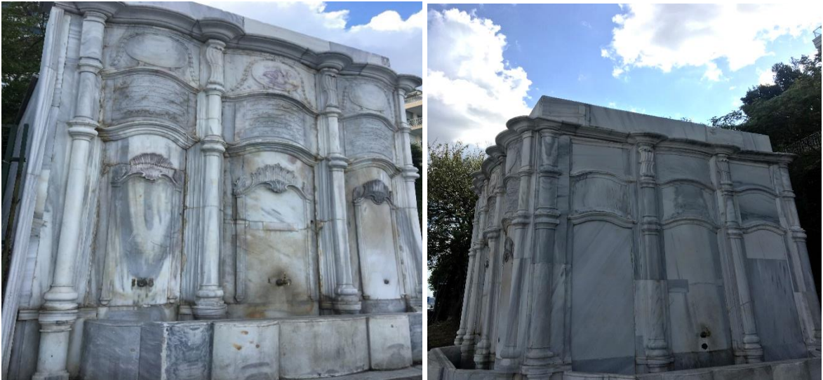
Şekil 4: Arnavutköy Beyhan Sultan Çeşmesi (Sena Sezen Özen Alabaş, 2021, Arnavutköy/İSTANBUL).

1879 tarihinde atıl ve bakımsız kalmıştır. 1950'lerde Bebek sahil yolu genişletme çalışmaları sırasında yerinden kaldırıldığı bilinmektedir. Bu durumda günümüzdeki çeşme, yeniden yerleştirilmiş hali ile karşımıza çıkmaktadır. (BOA, ŞD. 792.32; Egemen, 1993: 202). Ancak günümüzde çeşmelerinden su akmamaktadır. Mimari yapısı ise oymalı süslemeleri ve tamamen beyaz mermerdendir. Barok ve Rokoko tarzlarını yansıtır. Arnavutköy Sahili'nin de simgesi niteliğindedir.