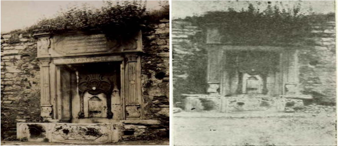
Şekil 2: Yeşildirek'teki Şah Sultan Çeşmesi (Encümen Arşivi, 1936; Tanışık, 1943: 212-214).

Ancak çeşmenin konumundan hareketle, çeşme hakkında bazı değerlendirmelerde bulunabiliriz. Konum olarak Eminönü, Mahmutpaşa ve Kapalı Pazar gibi tarihi çarşılara epey yakındı. Şah Sultan, esnaf ve çarşı, pazara gelen halkın su ihtiyacının giderilmesi amacı ile bu bölgeyi seçmiş olabilir. Zira bahsi geçen yerler geçmişte de günümüzde de alışveriş ve ticaret için uğrak yerlerdir. Ancak insan yoğunluğunun fazla ve göz önünde olan bir bölgeye inşa edilmesine karşın, bakımsız kalarak ortadan kalkması şaşırtıcıdır. Çeşmeye ait görsel materyaller de sınırlıdır (Encümen Arşivi, 1936; Tanışık, 1943: 212-214). Çeşmenin sahipsiz kaldığını ifade edebiliriz. Tamiri ve bakımı için bir bütçe ayrılmaması ve bir gelir tahsis edilmemesi çeşmenin sonunu hazırlayan faktörlerdendir. Çeşme 1940 senesine dek ancak dayanabilmiştir. Bu noktada bir hayır eserinin varlığını uzun süre koruyabilmesi, esere sabit bir gelir kaynağı tahsis edilmesi ile ilişkilidir. Elbette bu tür hayır eserleri, bir hayırsever tarafından da onarılabilir. Ancak ilk yöntem daha güvenlidir.