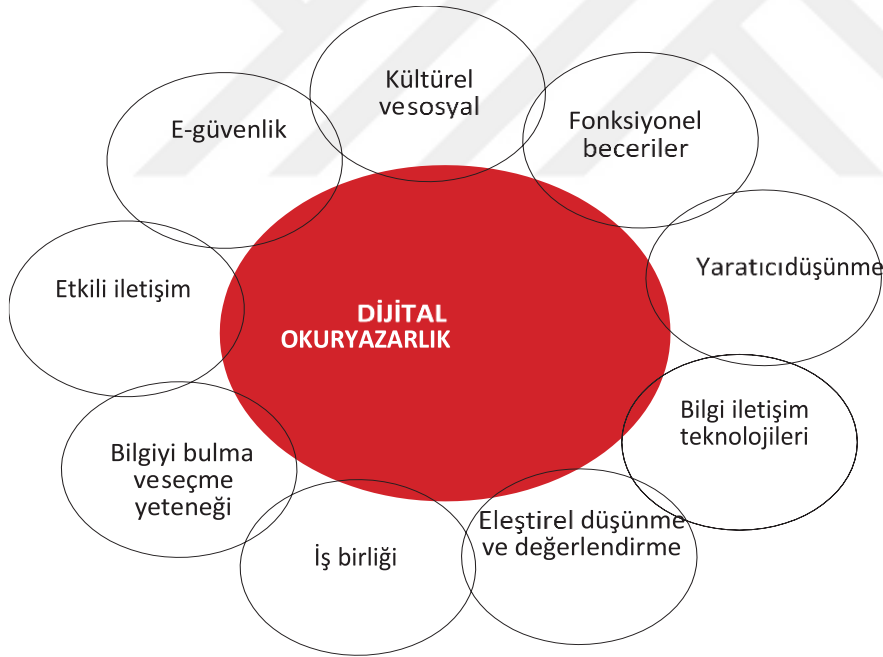
Şekil 2. Dijital okuryazarlığın boyutları (MEB, 2020)

Dijital okuryazarlık ile ilgili tanımlara bakıldığında dijital okuryazarlığın teknolojik araçları kullanabilmekten öte bu araçlar aracılığıyla bilgi edinme, analiz ederek sorgulama, yeni bilgiler üretme becerileri olarak ifade etmek mümkündür (Buzkurt, 2021)