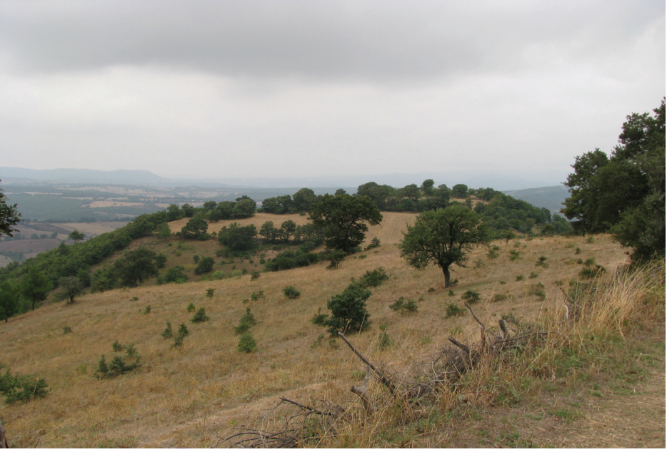
Figür 1: Pers hakimiyeti zamanında Troas'da tespit edilen küçük yerleşim yerlerinden biri.