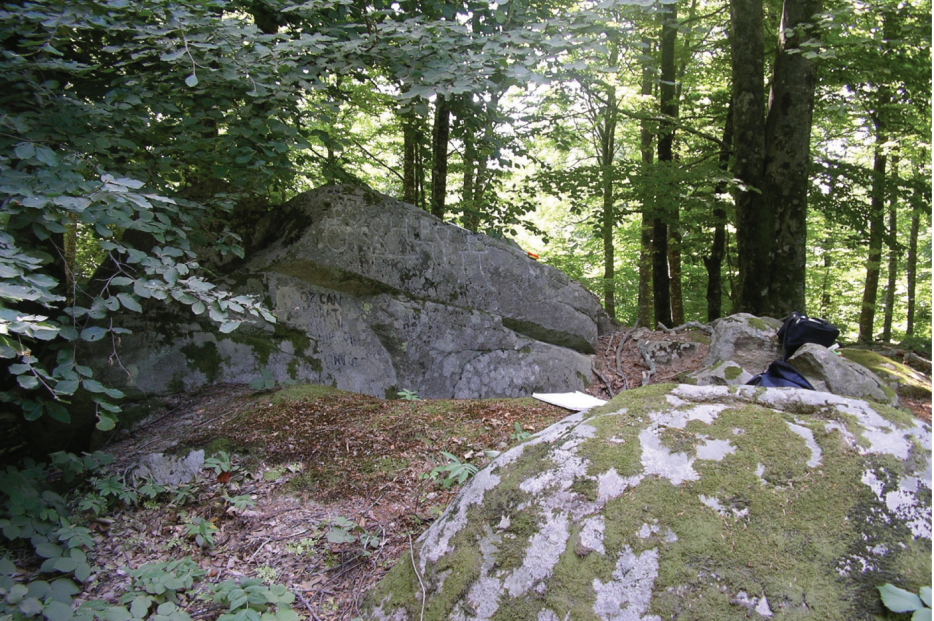
Figür 2: Pannukomme arazisinin batı sınırını gösteren sınır taşı yazıtı.