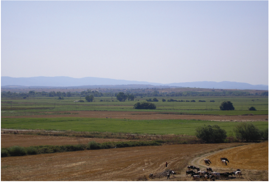
Figür 3: Granikos savaş alanının doğu yönden (Perslerin gözünden) görünümü.