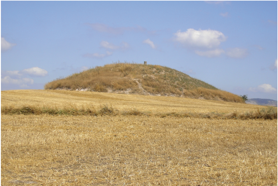
Figür 4: Troas bölgesinde bulunan çok sayıda tümülüstten biri.