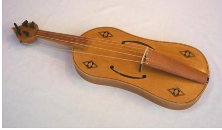
Resim4. Fidel (vielle).