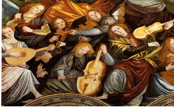
Resim6. Keman ailesi (1535), Gaudenzio Ferrari, Saronno Katedrali, İtalya. ( http://www.orpheon.org/OldSite/Seiten/education/OldestViolin.htm Erişim tarihi: 5.04.2016)