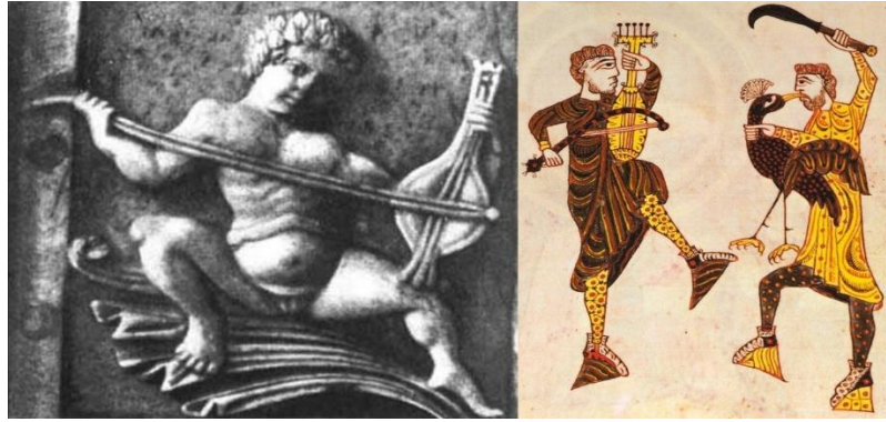
Resim 1. Solda: Bizans rebapı İ.S. 1000, Museo Nazionale, Florence. Sağda: İspanya antifonu İ.S. 1109 British Library ( http://earlymusicmuse.com/rebec/ erişim tarihi: 31.3.2016)