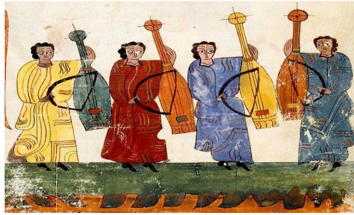
Resim 2. İ.S. 950, Yaylı Çalgılar, Serafin Estebanez Calderon Kütüphanesi: San Millan de la Cogolla, İspanya ( http://davidofsantabarbara.com/Galleries/Art/Gallery%20-%20Art%20-%200950%20AD%20%20Bowed%20Strings.htm erişim tarihi: 2.5.2016).