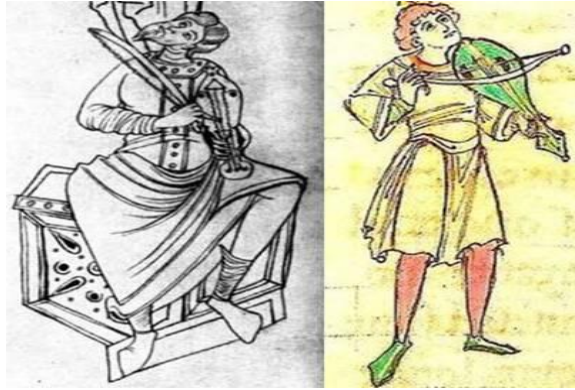
Resim 3. Solda: Avrupa rebek çalgısı, İ.S. 1050 Katalan Mezmuru'ndan. Sağda: 12. yy'ın ilk çeyreğinde rebek çalgısı ( http://earlymusicmuse.com/rebec/ erişim tarihi: 31.3.2016).