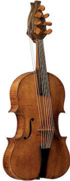
Resim5. Lira Da Braccio 1525, Giovanni Maria da Brescia, ( http://www.ashmoleanprints.com/image/1056136/giovanni-maria-da-brescia-lira-da-braccio-c-1525 , Ashmolean Museum of Art and Archaeology University of Oxford, erişim:5.4.2016).

Bizans lirası, diğer bir deyişle fidel, vielle ya da viyola Ortaçağ Avrupası'nın ana çalgısı olmuştur. Avrupa fidelinin 10. ve 11. yüzyıllar arasındaki resimlemelerinde 1, 3, 4 ya da 5 telli olduğu görülmektedir. Batıda fidelin akord düzenini sadece 1250 yılında Paris'te yaşayan Hieronimus de Moravia dile getirmiştir. Buna göre çalgının akordu "d G g d' d', d G g d' g' ya da G c g d'" şeklinde yapıyordu. Başlarda çello gibi dikey olarak tutularak çalınan fidel, Avrupa'ya geldiğinde hemen hiç dikey olarak çalınmamış, tutuş pozisyonu aynı modern kemanda olduğu gibi omuza yaslanmıştı (Sachs, 2006, ss. 276- 277).