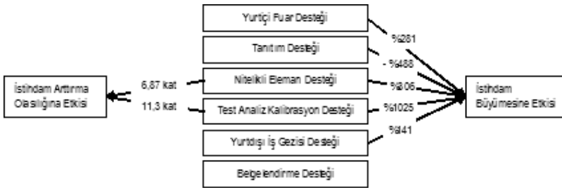
Şekil 2. KOSGEB Genel Desteklerinin İstihdam Artışına Etkisi

KOBİ'lere yönelik kamusal destekler dünya örneklerinde olduğu gibi Türkiye'de de ekonomi politikasının ayrılmaz bir parçasını oluşturmaktadır. Özellikle AB'ye uyum süreci dahilinde Türkiye KOBİ politikasının sınırları daha net çizilmiş ve bu