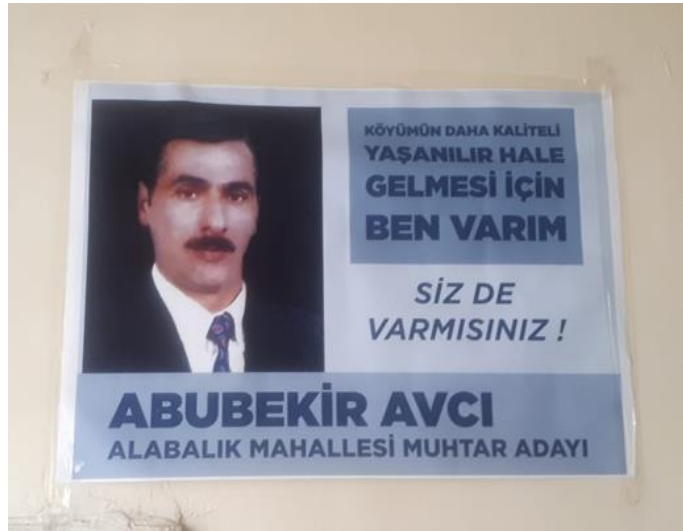
Görsel 5. Afiş