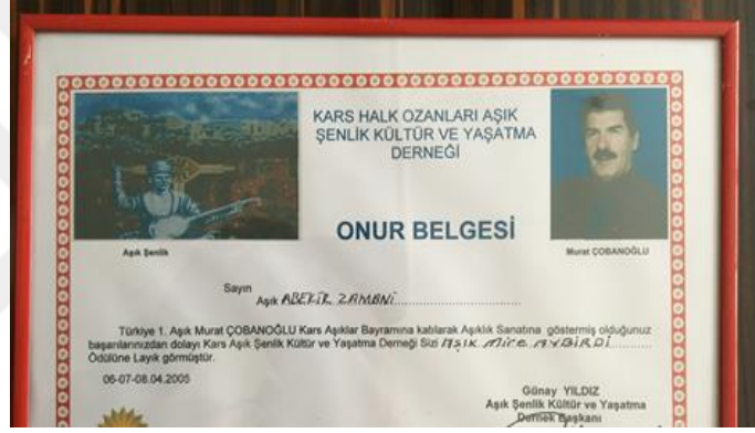
Görsel 4. Belge