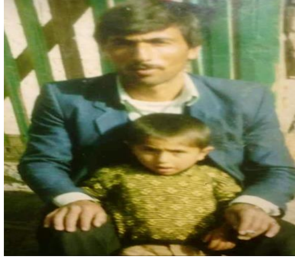
Görsel 3. Fotoğraf