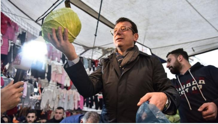
Şekil 49. Ekrem İmamoğlu semt pazarında lahana satışı yaparken.

Seçim çalışmalarını “ saha kampanyası ” üzerine inşa etmiş olan Ekrem İmamoğlu pazar, mahalle, ev ve sokak gezileri esnasında esnafa ve halka kendini doğrudan anlatabilme ve halkın sorunlarını da aracısız bir şekilde dinleme şansı elde etmiştir. Bu seçim ziyaretleri esnasında İmamoğlu'nun seçmiş olduğu kıyafetleri de önem teşkil etmektedir. Zira İmamoğlu bu ziyaretlerinin birçoğunda sade ve günlük bir giyim tarzı tercih etmiştir. Bu sayede yine halkın nezdinde bizden biri algısının güçlenmesini sağlayarak halka ulaşmayı başarmıştır.