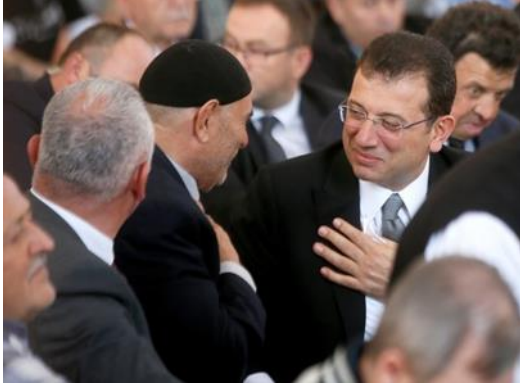
Şekil 44. Ekrem İmamoğlu Atatürk'ün Mevlit' inde