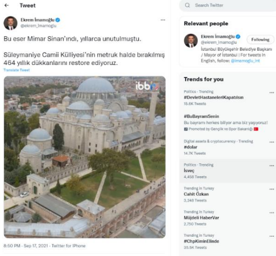
Şekil 59. Ekrem İmamoğlu Süleymaniye Camii Külliyesi paylaşımı (İmamoğlu, 2021)