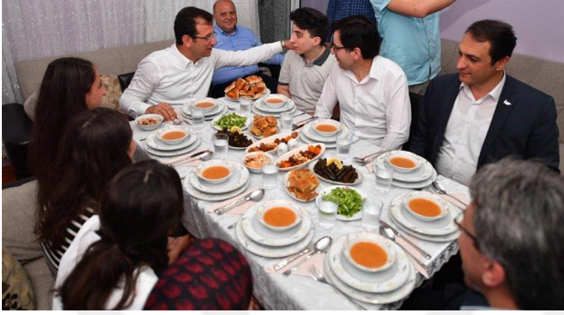
Şekil 40. Ekrem İmamoğlu ve Köse ailesi

Söylemlerinde sıklıkla Ramazan ayının hem dini önemine hem de kendi nezdinde var olan önemine değinen Ekrem İmamoğlu Ramazan aylarında İstanbullu vatandaşların evlerine konuk olarak onlarla birlikte iftar yapmıştır.