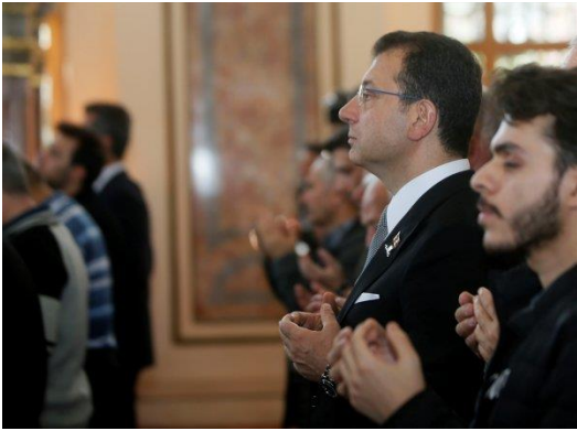
Şekil 43. Ekrem İmamoğlu Atatürk'ün Mevlit' inde

"Bu ruhun önderi Mustafa Kemal Atatürk'tür. Milli duruşumuzu bir arada göstereceğimiz anlar var. Bunlar çok değerli, kol kola ve omuz omuza olmamız, geçmişimizi hatırlamamız ve geleceğe de umutla yürüyüşümüz çok önemlidir. Bugün de atamızın 81. ölüm yıl dönümü. Atamızı hem anlayarak hem de dua ederek anmanın günü." (En Son Haber, 10.11.2019) demiştir.