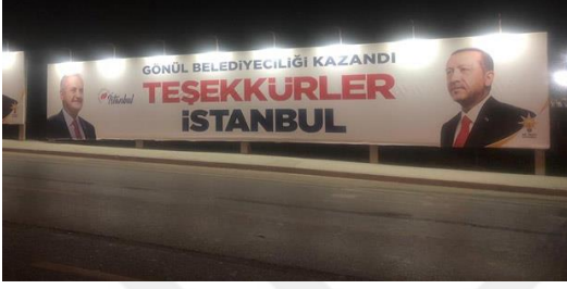
Şekil 23: Ak Parti Billboard Görşeli

"Bu bir tarafın kazanma bir tarafın kaybetme seçimi değildir. Ben takdir tebrik etmeyi bilirim, aynı şekilde tebrik edilmeyi de beklerim. Zira sürecin en hassas bir şekilde neticelenmesi için görev yapan arkadaşlara teşekkür ediyorum. Emniyet mensuplarına teşekkür ediyorum" demiştir. (Yeni Soluk, 31.03.2019).