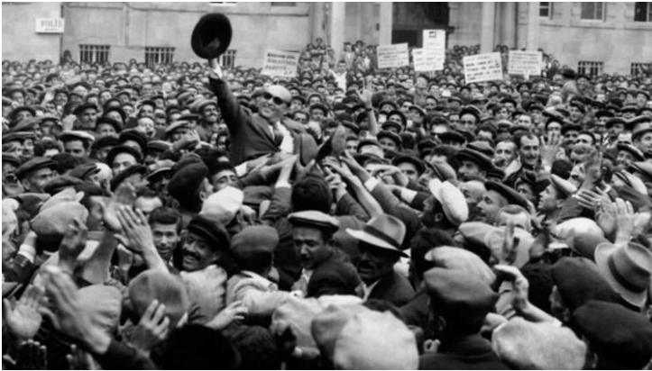
Şekil 3. Süleyman Demirel ve Halk

Erdoğan (1998: 25) popülizmin sadece bir “fikirler bütünü” olmaktan ziyade kendini pratiklerde de maddileştirdiğini ve popülist liderlerin yaşam tarzlarının, dil, giyim kuşam ve üsluplarının halkla kurmuş oldukları dolayumsuz yakınlık ve özdeşlik ilişkisinin bir göstergesi olduğunu vurgulamıştır. Bu bağlamda Demirel’in popülist liderlerin özelliklerine sahip olduğunu söylemek yanlış olmayacaktır. Bora ve Erdoğan (2003: 636)’ın da belirttiği gibi “Demirel; Isparta ağzıyla, kısa, basit, betimleyici, soru-yanıt şeklinde cümlelerle konuşarak, ‘halkın’ saf-safiyane duygularını ve zihin dünyasını paylaştığını gösteren bir hitabet kurmuştur. Tam da bu monolog şeklindeki soru-yanıtlar, kendini ‘halk’ ın yerine koyarak ‘aklıselime’ seslenmenin etkili bir yoludur; zira tek homojen basit biz öze sahip bir ‘ortak duyu’ varsayımını içerir. Demirel hitabetinde bu ‘ortak duyu’ yu çoğu zaman küçük üreticinin, köylünün, esnaf ve zanaatkarın anlam dünyasıyla, Gramsci’ nin (1971: 42) deyişyle ‘kalabalıkların kendiliğinden felsefesi’ ile özdeşleştirmiştir” Başka bir ifadeyle Demirel’in halkın anlayabileceği ve halk ile rahat bir şekilde iletişim kurabileceği basit ve sade bir konuşma tarzını tercih etmiş olması, şiveli konuşması gibi özellikleri onun popülist unsurlar taşıdığına bir göstergesi sayılabilir.