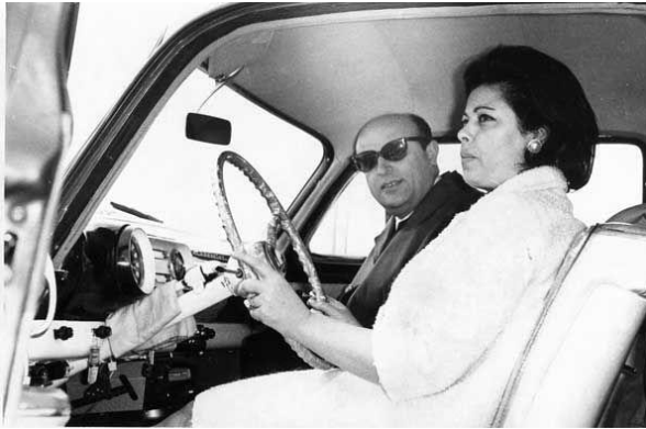
Şekil 2. Süleyman Demirel ve Nazmiye Demirel

Demirel “modernlik ile milli otantizmin” bağdaşabileceğini başarılı bir şekilde sunabilmiş ve modernliği din kaynaklı gelenek ve değerlerin temizlenmesi olarak gören elit gruba karşı, geleneksel değerlerden uzaklaşmadan da modern olunabileceğini göstermiştir. Mühendis olmuş, Batı'yı görmüş, para kazanmış ve aile ilişkileri ile modern bir çizgiye sahip birinin bununla birlikte geleneksel değerlerinden kopmaması ve Batılılaşmış Türk elitinden farklı olarak halka tepeden bakmaması Türk toplumu için oldukça önemli olmuştur (Demirel, 2021: 42).