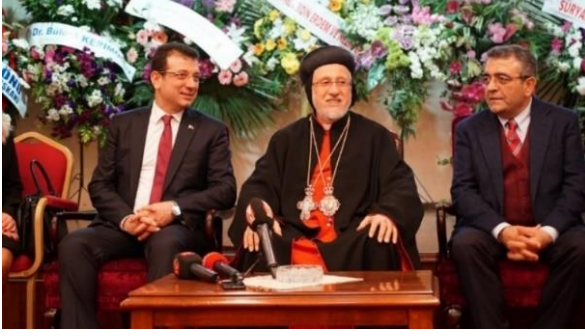
Şekil 31. Ekrem İmamoğlu, Süryani Kadim Meryem Ana Kilisesi ziyareti