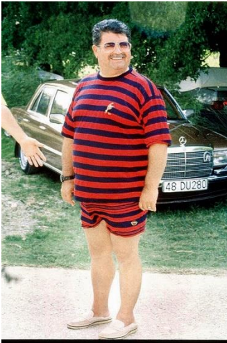
Şekil 6. Günlük kıyafetleriyle Turgut Özal