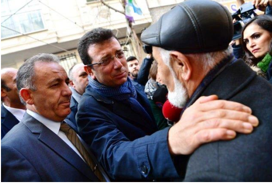
Şekil 46. Ekrem İmamoğlu ve yaşlı amca buluşması