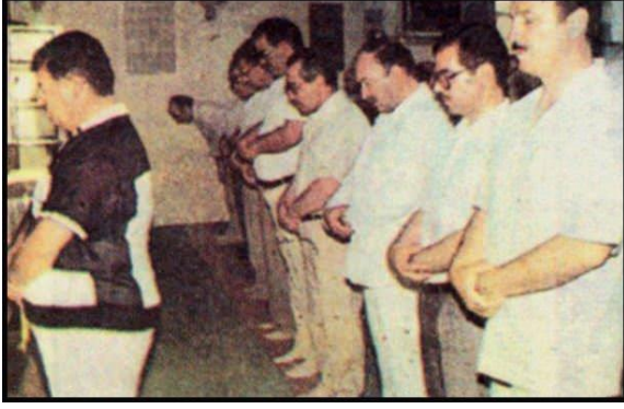
Şekil 8. Turgut Özal, Medine'de Kuba Mescidi'nde namaz kıldırırken