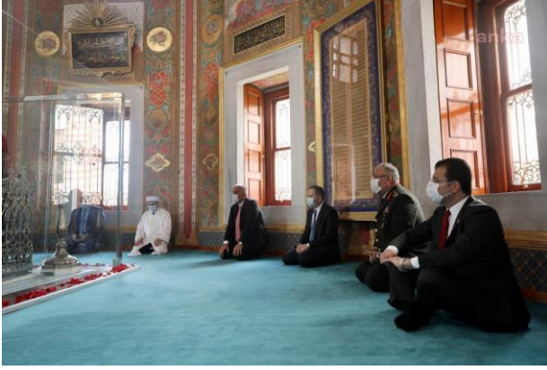
Şekil 56. Ekrem İmamoğlu, Fatih Sultan Mehmet Türbesi'nde