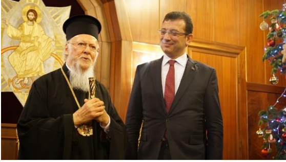
Şekil 30. Ekrem İmamoğlu, Fener Rum Ortodoks Patrikhanesi ziyareti

Ekrem İmamoğlu Rum Patriğini ziyaret ettikten sonraki sözlerinde İstanbul'un hem dinsel hem de etnik çeşitliliğinin İstanbul'a katmış olduğu değeri ve önemi vurgulayarak tüm bu değerlere sahip çıkılacağını belirtmesi dinsel ve etnik kimlikler üzerinde bir halk inşasının önemli bir örneğidir.