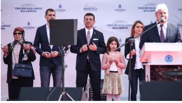
Şekil 38. Maltepe Mitingi

İmamoğlu'nun sağ, muhafazakar, milliyetçi popülizmden faydalandığının önemli bir göstergesidir.