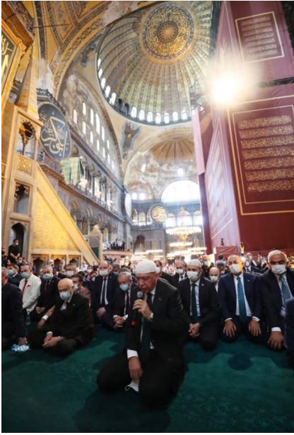
Şekil 16. Recep Tayyip Erdoğan Ayasofya’da Kur’an-ı Kerim Okurken