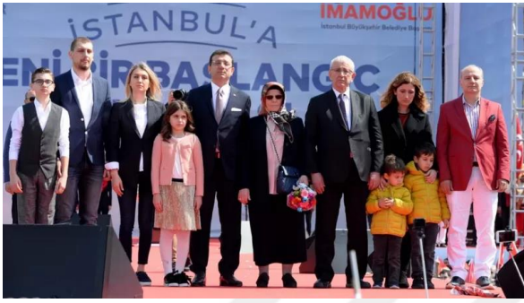
Şekil 28. Ekrem İmamoğlu’nun Maltepe Mitingi

17 Nisan 2019’da mazbatasını alan Ekrem İmamoğlu, 18 Nisan 2019’da göreve başlamıştır. Ekrem İmamoğlu mazbatasını alıp göreve başladıktan sonra halk ile buluşmalarına devam etmiş ve ilk olarak 21 Nisan tarihinde “İstanbul’a Yeni Bir Başlangıç” adını taşıyan miting düzenlenmiştir. Yüzbinlerce insanın katıldığı mitingde “Hak, hukuk, adalet” ve “Ekrem Başkan” sloganlarıyla Ekrem İmamoğlu ve ailesi sahneye çıkmıştır. Atatürk, silah arkadaşları ve şehitler için 1 dakikalık saygı duruşunun ardından İstiklal Marşı okunmuştur. Daha sonra ise bir imam eşliğinde dualar okunmuştur (BBC, 21.04.2019).