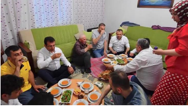
Şekil 35. Ekrem İmamoğlu yer sofrasında