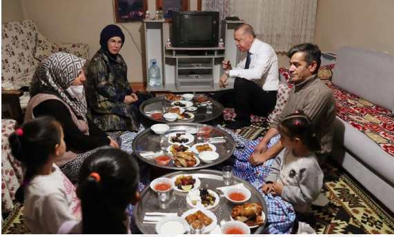
Şekil 10. Recep Tayyip Erdoğan Yer Sofrasında Yemek Yerken

Erdoğan'ın zaman zaman yapmış olduğu ev ziyaretleri ve bu ziyaretler esnasında yer sofrasında yemek yemesi, yerde oturarak sohbet etmesi, yine esnaf ya da mahalle gezileri gibi halk ile iletişime geçtiği ziyaretleri esnasında halk ile yakın temas halinde olması Erdoğan'ın halkın içinden gelen, bizden biri olan lider imajını destekler nitelik taşımaktadır.