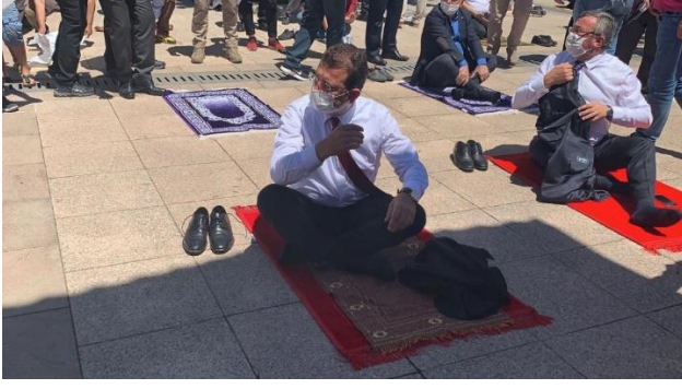
Şekil 42. Ekrem İmamoğlu Cuma namazı kılarken