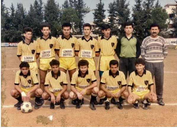
Şekil 17. Ekrem İmamoğlu Kıbrıs Limasol Spor Kulübünde

bölümünü kazanmıştır. Ancak kısa bir süre sonra kaydını Girne Amerikan Üniversitesi İletişim Fakültesi İşletme bölümüne aldırıştır. 1