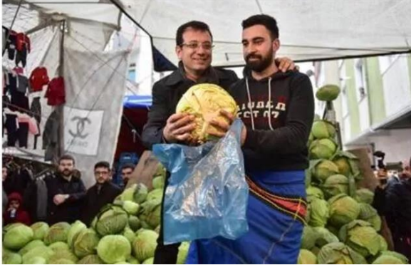
Şekil 34. Ekrem İmamoğlu semt pazarda