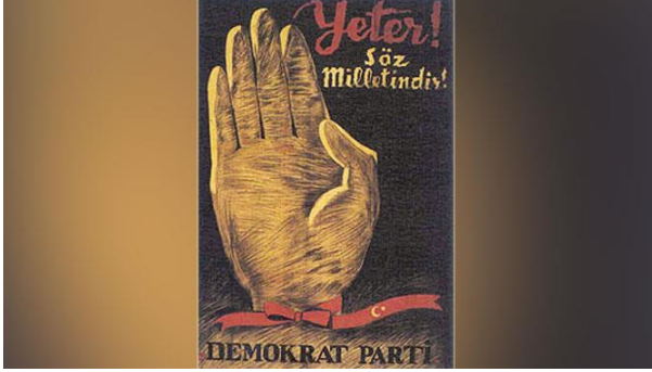
Şekil 1. DP Afişi

Milletin ” sloganı (Gülsünler ve Ertürk, 2012: 97) da DP’nin anti-elitist görüşünü kanıtlar niteliktedir.