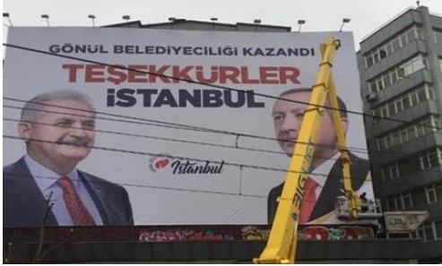
Şekil 24: Ak Parti Afışı