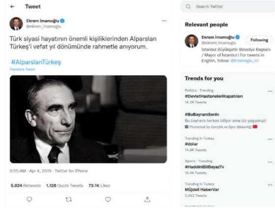
Şekil 53. Ekrem İmamoğlu'nun Alparslan Türkeş Paylaşımı

Ekrem İmamoğlu toplumun sağ, muhafazakar, milliyetçi kesim için özel bir yere sahip olan Milliyetçi Hareket Partisi'nin kurucu genel başkanı Alparslan Türkeş'in ölüm yıldönümünde resmi Twitter hesabından Türkeş'in 22. Ölüm yıldönümü sebebiyle bir anma mesajı yayınlamıştır.