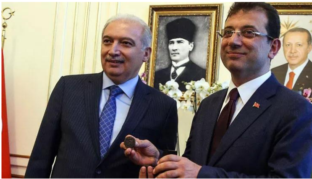
Şekil 27. Ekrem İmamoğlu, Mevlüt Uysaldan İBB başkanlığını devralırken.

31 Mart seçimlerinden 17 gün sonra 17 Nisan 2019 tarihinde YSK tarafından yapılan basın açıklamasında Ekrem İmamoğlu'nun 4 milyon 169 bin 765, Binali Yıldırım'ın ise 4 milyon 156 bin 36 oy aldığı ilan edilmiştir. Resmi açıklamanın ardından Ekrem İmamoğlu İl Seçim kuruluna giderek mazbatasını almıştır. Ardından devir teslim töreni için Saraçhane'deki belediye binasına gelmiş ve İstanbul Büyükşehir Belediye Başkanlığı görevini Mevlüt Uysal'dan devralmıştır.