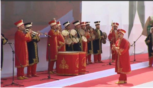
Şekil 52. Mehter Takımı

21 Nisan 2019'da Maltepe'de düzenlenen mitingde, dünyanın en eski askeri bandolarından biri olan ve sağ, muhafazakar, milliyetçi kesim için oldukça önemli bir anlam ifade eden "Osmanlı Yeniçeri Askeri Bاندosu'nun" gösteri yapmış olması dikkat çekici olmuştur. Ayrıca ilk kez bir CHP mitinginde Mehter Takımı'nın gösteri yapmış olması da oldukça önemlidir (En Son Haber, 21.04. 2019)