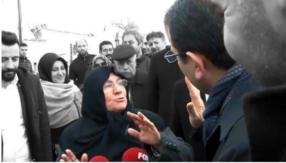
Şekil 45. Ekrem İmamoğlu Mahruze Keleş buluşması

Ekrem İmamoğlu: Senden oyunu değil, duanı istiyorum. Seçimi kazanacağım ve 1 ay içinde evinize geleceğim. Böreklerinizi, ketelerinizi yiyeceğim, enerji alıp, 5 yıl deli gibi çalışacağım. (Sözcü, 07.08.2019) İmamoğlu'nun kullanmış olduğu samimi, doğal ve içten diline örnek olarak verilebilir.