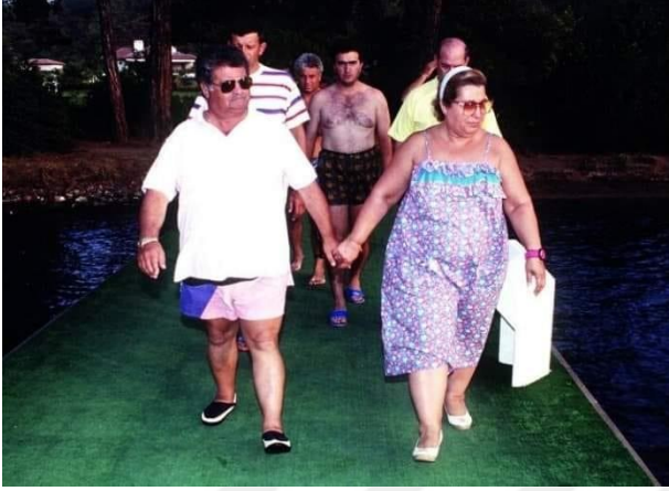
Şekil 5. Turgut Özal ve Semra Özal

Özal, sahip olmuş olduğu sıradan halkın içinden gelme imajını başbakan ve cumhurbaşkanı olarak görev yaptığı dönemlerde sergilemiş olduğu tutum ve davranışlarında da muhafaza etmiş ve Cemal (1990: 98)'e göre hiç de devletlu olmayan sıradan bir insan görüntüsü vermeye çalışmıştır. Özalların karı-koca el ele dolaşmaları, bazı dönemler kaçamak yaparak Bodrum, Marmaris gibi tatil yörelerinde birlikte görünmeleri, dans etmeleri Türkiye'de alışılmışın dışında görüntüler olmuştur.