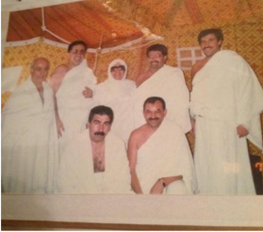
Şekil 7. İhram Kıyafetleriyle Turgut Özal

Özal'ın gerek bürokratik yaşamı boyunca gerek başbakan ve cumhurbaşkanı olarak görev yapmış olduğu siyasal yaşamı boyunca popülist stratejileri başarılı bir şekilde kullandığını söylemek mümkündür. Bu bağlamda Özal'ın, özellikle sağ popülizmde sıkça başvurulan dini motifleri de etkin bir şekilde kullanmış olduğu dikkat çekmektedir. Cemal (1990: 166)'e göre, Özal iktidarı laiklik karşıtı akımların, muhafazakar ideoloji ve politikaların gelişmesini kolaylaştıracak tutumlar sergilemiştir. Öyle ki, 1970 yılında 40 olan imam-hatip liselerinin sayısı 1980'de 249'a ve 1988 yılında ise 383'e ulaşmıştır.