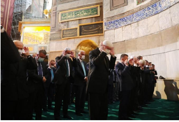
Şekil 15. Recep Tayyip Erdoğan Ayasofya’da Namaz Kılarken