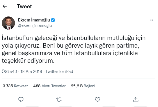
Şekil 20. Ekrem İmamoğlu İBB adaylık açıklaması Twitter paylaşımı

açıklamıştır. Ekrem İmamoğlu İBB başkan adaylığının resmi olarak açıklanmasının ardından Twitter hesabından da şu paylaşımı yapmıştır: