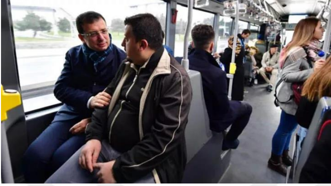
Şekil 50. Ekrem İmamoğlu metroda

tezgahına çıkararak satış yapması İmamoğlu'nun ziyaretleri esnasında doğal bir tutum sergilediğinin bir göstergesidir.