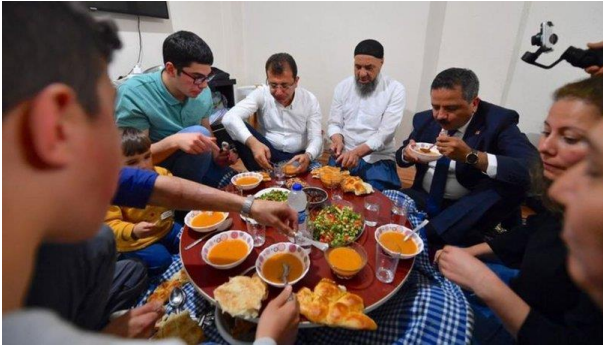
Şekil 32. Ekrem İmamoğlu iftar yemeğinde

İmamoğlu'nun gerçekleştirmiş olduğu ziyaretleri esnasında sergilemiş olduğu tutum ve davranışlarıyla insanların değerlerine önem verdiğini göstermiş olması bizden biri algısını güçlendiren en önemli özelliklerinin başında gelmektedir. Bu bağlamda İmamoğlu'nun yapmış olduğu ev ziyaretleri esnasında evlerine konuk olduğu aileler ile birlikte yer sofrasında yemek yemesi bu ilişkiye verilecek önemli örneklerden biridir.