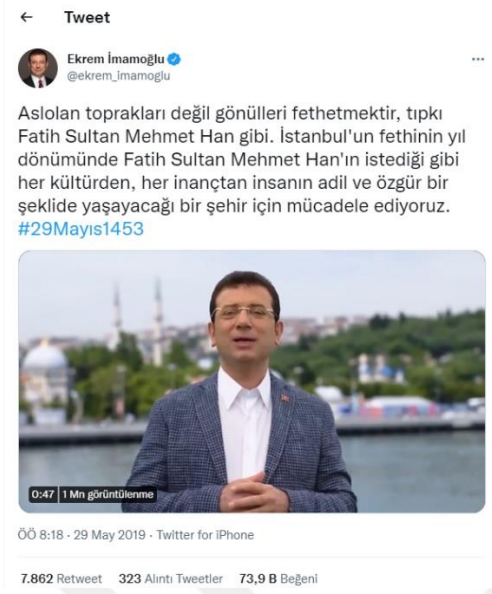
Şekil 55. Ekrem İmamoğlu'nun İstanbul'un fethinin yıldönümü mesajı (İmamoğlu, 2019)

İstanbul Valiliği tarafından "İstanbul'un Fethi'nin 567. Yıldönümü Kutlama Programı" adlı törene katılan Ekrem İmamoğlu, törenin ardından şu cümlelerle duygularını ifade etmiştir: