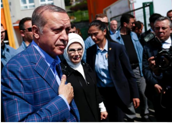
Şekil 9. Prestogal Ceketiyile Recep Tayyip Erdoğan

sokaklarında, mezarlıklarda veya yoksul mahallelerde yürüyüşler yapması halk ile yakınlık kurmasının bir göstergesi olmuştur (Kaya, 2019: 25). Bu bağlamda Erdoğan'ın konuşma tarzı, konuşmalarının içeriği, bedensel duruşu, kamusal alanda sergilemiş olduğu zevkleri ve duyguları, kendisini destekleyenler ile arasındaki popülist bağları güçlendirmiştir (Baykan, 2019: 19).