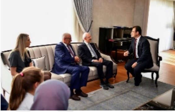
Şekil 18. Kemal Kılıçdaroğlu'nun Ekrem İmamoğlu'na ev ziyareti

evi. Oğlanı istemeye gelmişler, naz etme” dedi. Bu renkli diyalogların evde kahkahalara neden olduğu öğrenildi.” (Odatv,13 Aralık 2018)