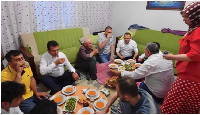
Şekil 33. Ekrem İmamoğlu yer sofrasında

Beylikdüzü'nde yaşayan Kılıçalp ailesinin evine konuk olan İmamoğlu'nun yine aile üyeleri ile birlikte yer sofrasında iftarını açması İmamoğlu'nun halkın değerlerine ve kültürüne uzak olmadığını bir göstergesidir.