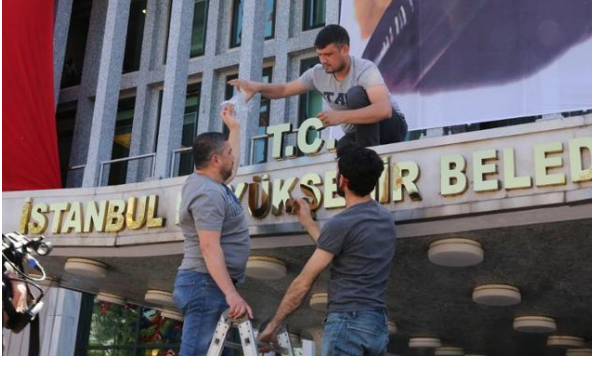
Şekil 29. İBB çalışanları İBB binasına T.C. harflerini eklerken