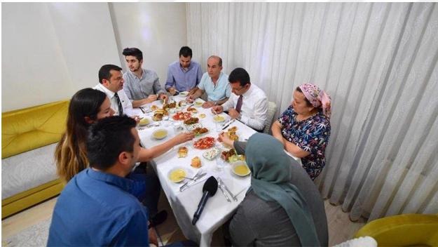
Şekil 41. Ekrem İmamoğlu ve Sarar ailesi