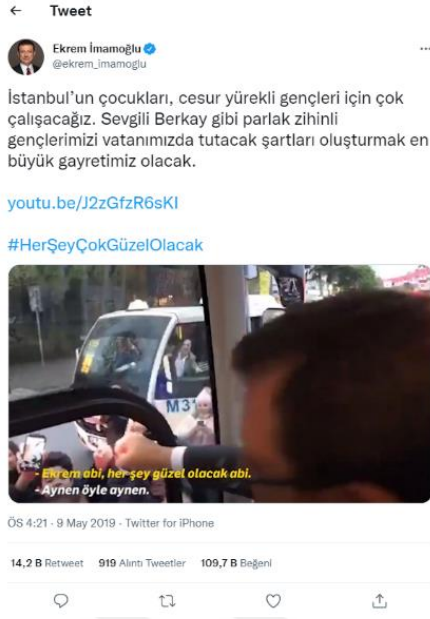
Şekil 26. Ekrem İmamoğlu'nun Berkay Gezgin Paylaşımı