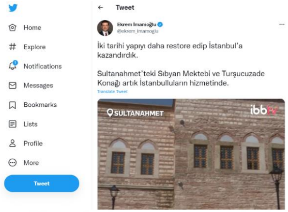
Şekil 58. Ekrem İmamoğlu Sıbyan Mektebi ve Turşucuzade Konağı paylaşımı (İmamoğlu, 2022)

değerlere vermiş olduğu önemi göstermek açısından ilgi çekici örnekler olması nedeniyle çalışmamızda yer almıştır.