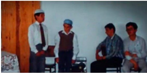
Şekil 37: Ekrem İmamoğlu Kur'an kursunda