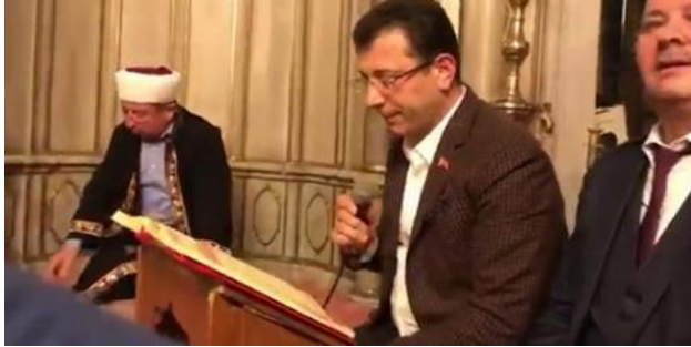
Şekil 39. Ekrem İmamoğlu Yasin okurken.