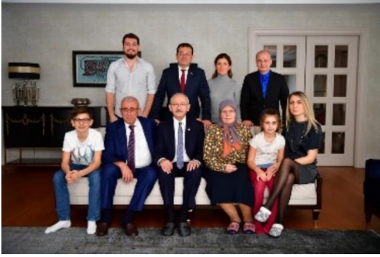
Şekil 19. Kemal Kılıçdaroğlu ve Ekrem İmamoğlu ailesi