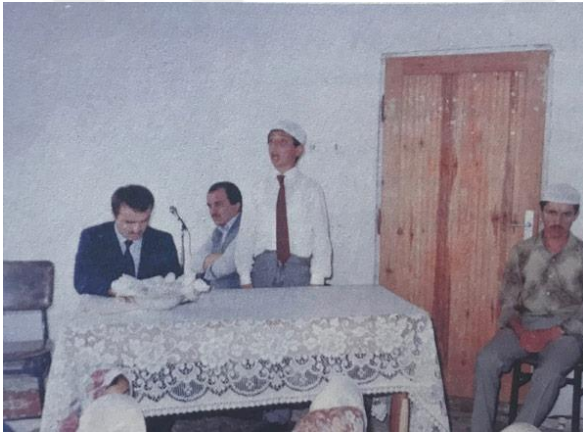
Şekil 36: Ekrem İmamoğlu Kur'an kursunda

Muhafazakar bir ailede büyüyen Ekrem İmamoğlu 5-6 yaşlarından itibaren din eğitimi almaya başlamış ve ilkokul birinci sınıfta Kur'an okumayı öğrenmiştir.