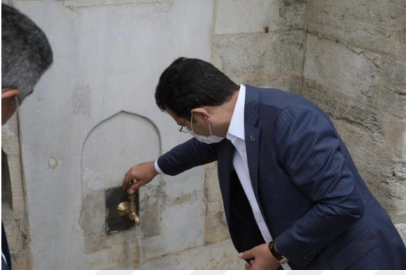
Şekil 54. Ekrem İmamoğlu tarihi Kazlı Çeşme Ziyareti.

“Burayı onarmış, teşekkür ediyoruz; tadil etmiş, güzel bir hale getirmiş ve onun yetki alanında. Bize de suyunu akıtmak nasip oldu. Bu iletişimle hemen hemen bütün tarihi çeşmelerin suyunu akıtmak istiyoruz. İnsanlar bunu başka yerlere koysa da bu aslında tarihe saygı. Yarın 29 Mayıs; İstanbul'un fethi. Tarihe saygı, bu tür uygulamalarla, tarihi anlamakla, onu hissetmekle ve yarınlara bunu geçirmekle olur. Çeşmenin kültürümüzdeki yerini anlatmakla olur. O bakımdan bu uygulamamız devam edecek. Beni de memnun ediyor. İnşallah bütün sularını akıtırız aziz İstanbul'un. (Sözcü 28.05.2020)