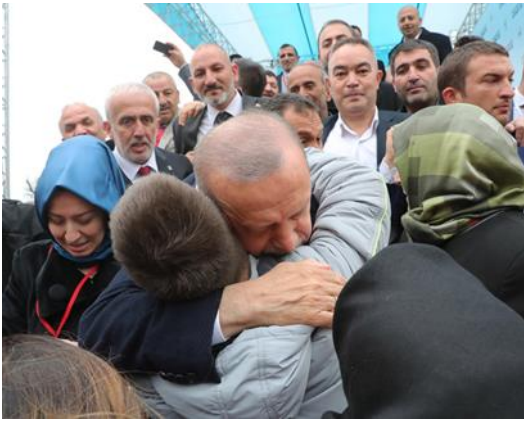
Şekil 11. Recep Tayyip Erdoğan Halkla Buluşması