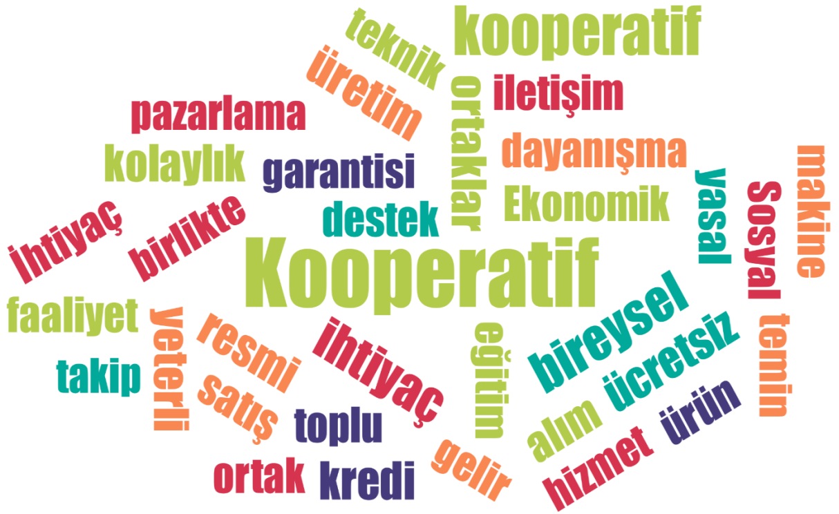
Şekil 5. Kelime Bulutu

MAXQDA 2022 Nitel Veri Analiz programı kullanılarak çalışma kapsamında görüşmeler kapsamında elde edilen verileri oluşturan içerik cevapları kullanılarak, “Kelime Bulutu” işlevi kelimelerin metin içerisinde kullanım sayıları ile orantılı olarak büyük yazı boyutu ile farklı renk atamaları sunulmuştur.