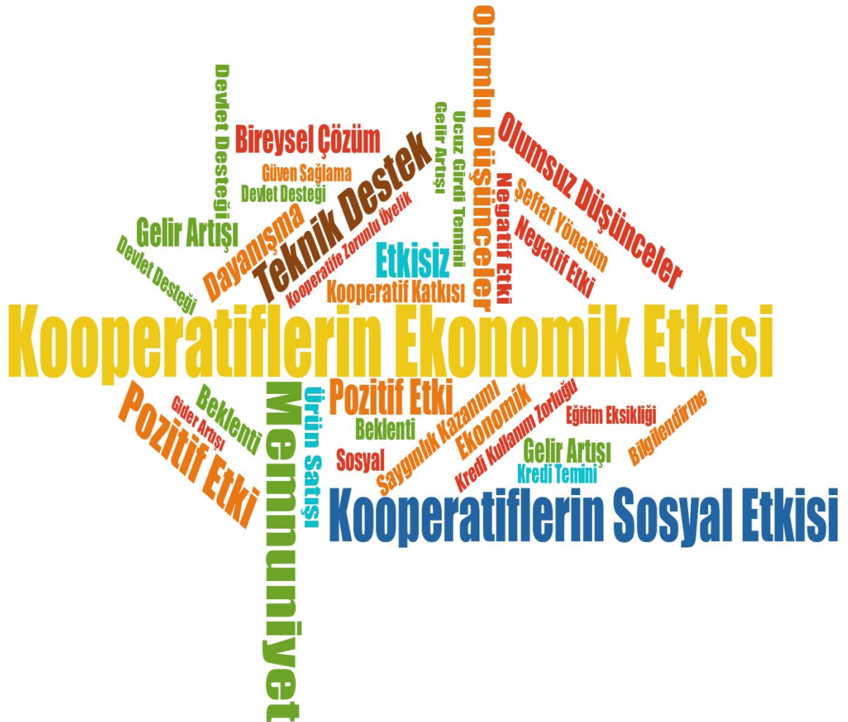
Şekil 4. Kod Bulutu

MAXQDA 2022 Nitel Veri Analiz programı kullanılarak çalışma kapsamında elde edilen veriler kodlanmıştır. “ Kod Bulutu ” işlevi ile katılımcıların görüşme kapsamında