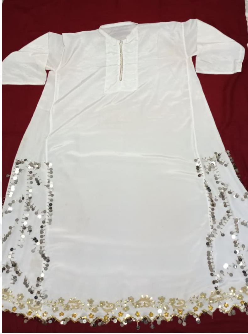
G rsel 20: K ynek

K ynek  st beden giysisi olup ten kafa ve kollardan geirilerek ayak bileklerine kadar uzanan beyaz renkli kumař  zerine dikilen s slemelerden oluřur. Omuzlara oturacak řekilde  stten dar yanlara ve etek ucuna dođru aılan iki peř paradan oluřmuřtur. Belden ayak bileklerine kadar iki yanlara iřlemeli veya boncuklu s slemeler yapılmıřtır.