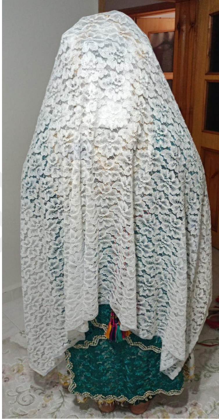
Görsel 29: Tahtacı Türkmen Gelini Duvağı: Bürümbe Arkadan Görünüm

Önceden gelinlik olmadığı için geline Türkmen kıyafetleri giydirilir ve duvak yerine de beyaz “bürümbe” takılır. Gelin olurken bu şekilde gelin olunurmuş. Günümüzde gelin çıkımından önce ve kepez giyilmeden gelin kız bürümbe bürünmektedir. Tahtacı Türkmenlerinin geleneksel duvağının ön ve arkadan görünüşleri bu şekildedir.