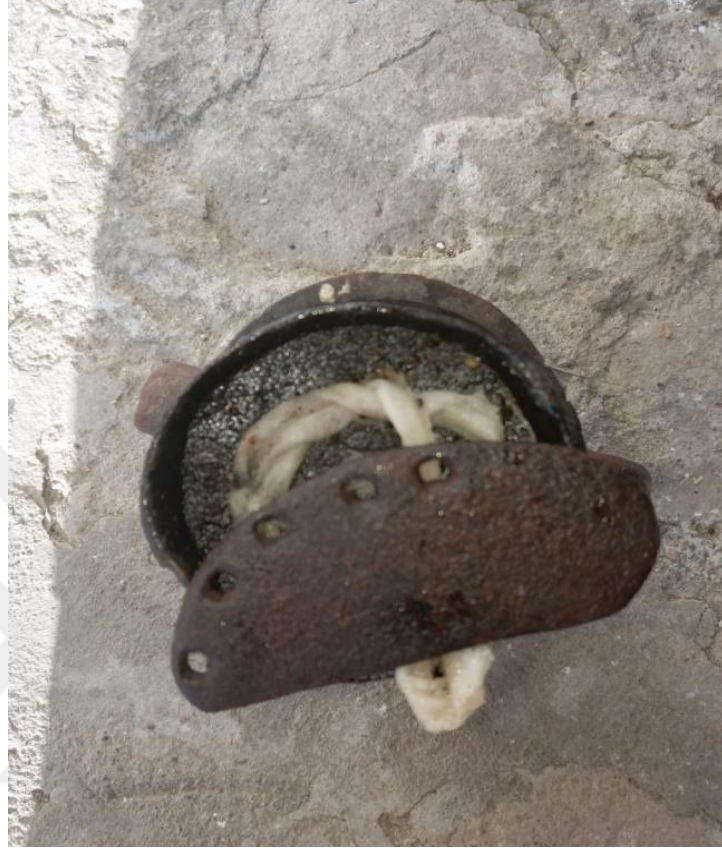
Görsel 3: Uyarılmak İçin Hazırlanan Delil

Hünkar Hacı Bektaş Veli de haldaşımız ola. Duası bizden, kabulü Allah'tan ola. Gerçeğe Hû.