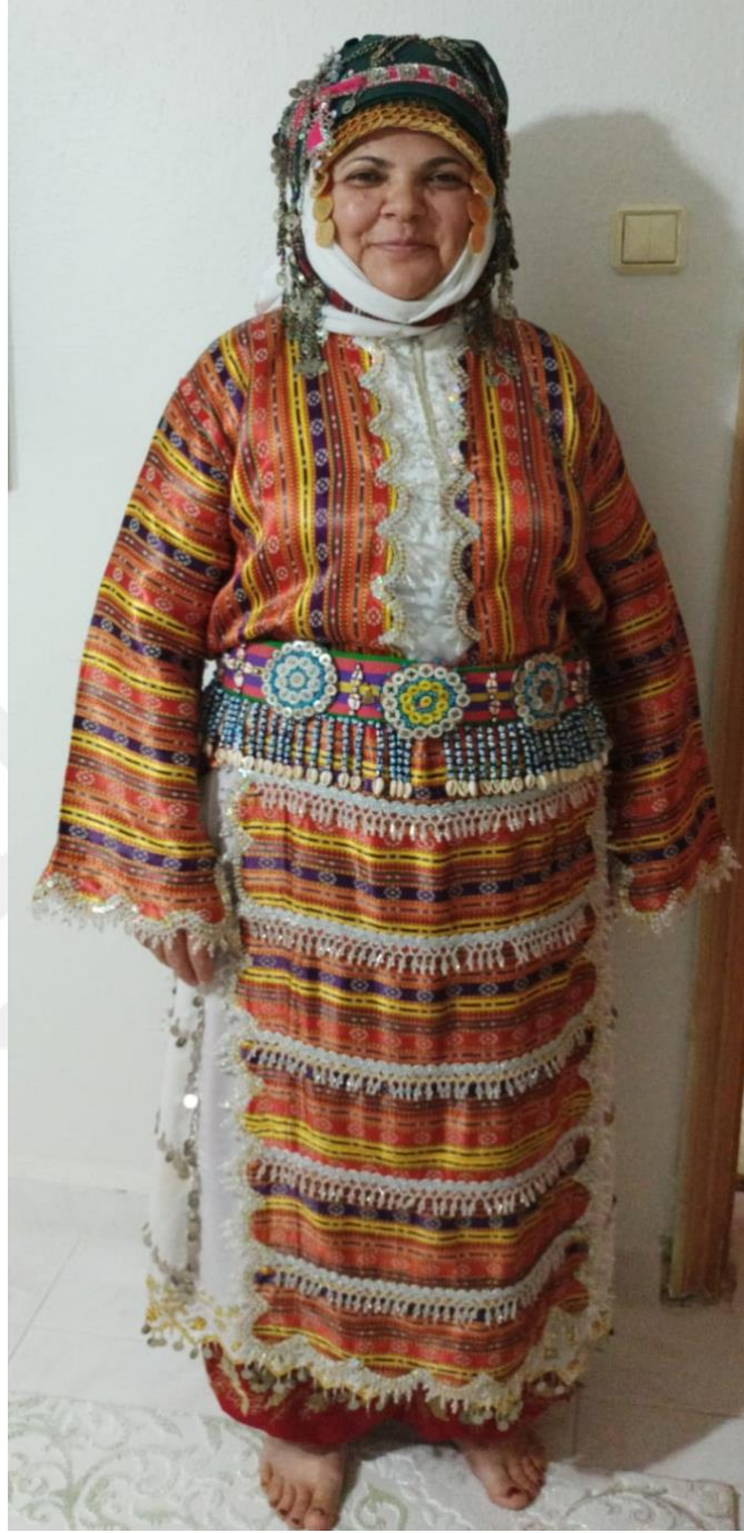
Görsel 18: Tahtacı Türkmen Kıyafeti Önden Görünüşü