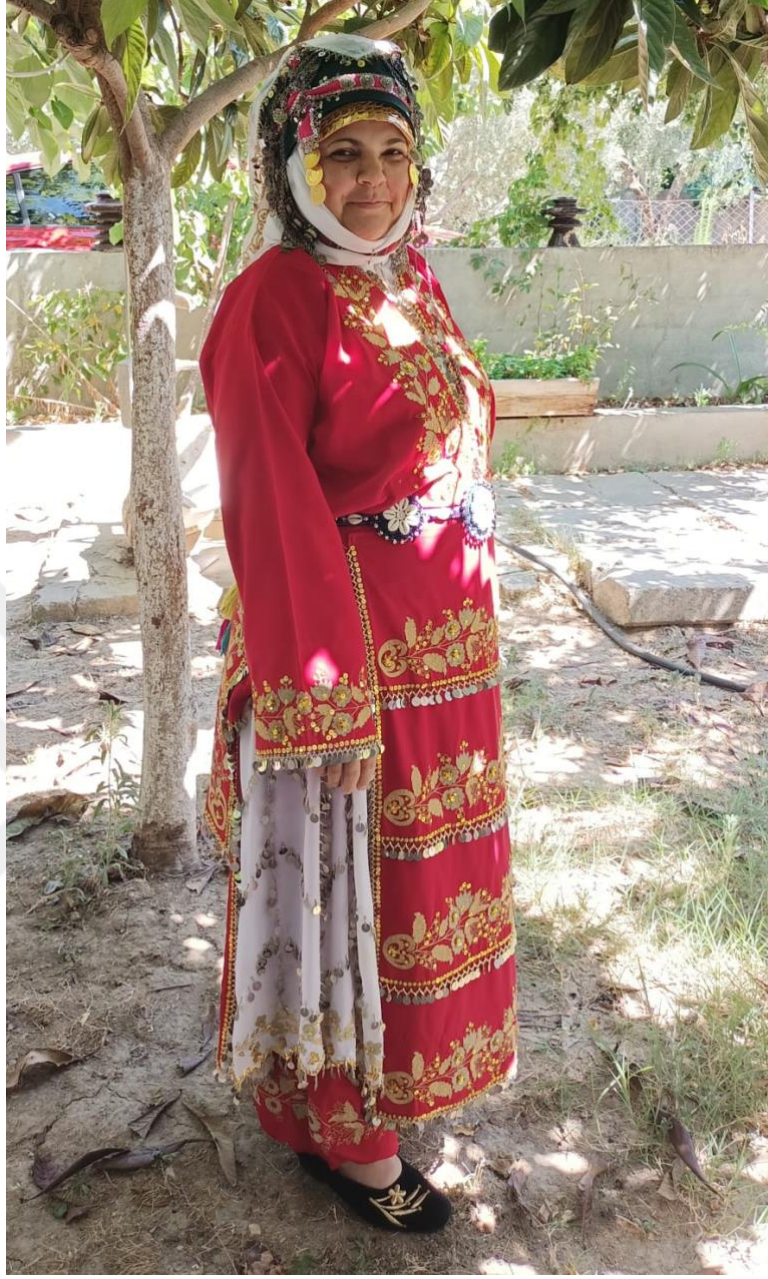
Görsel 17: Baş Bağlanan Gelin