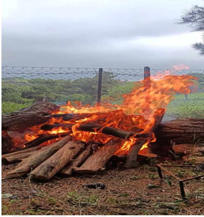
Görsel 11: Ocak ve Ateş Kültü