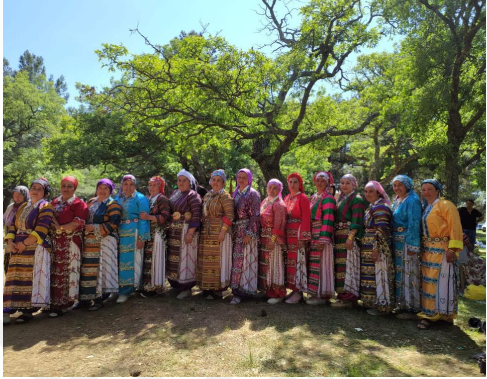
Görsel 13: Semah İçin Hazırlanan Türkmen Kadınları