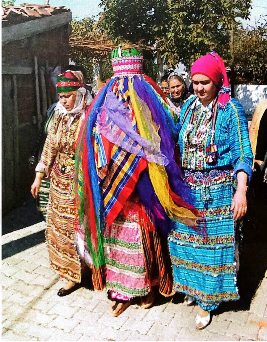
Görsel 15: Kepez Gezdirmesi

Ođlan tarafı başka köydense, kız tarafındaki köye gelir. Köyün girişinde, kız tarafı ođlan tarafını karşılamaya gider. Köyün girişinde kız tarafının karşılaması için beklenilir. Burada iki tarafın bayrađı buluşur. Salavat getirilir ve alay havası dönüldür. İki bayrak ve beraberindeki konuklar hep birlikte kız evine giderler. Kız tarafı ve ođlan tarafı aynı köydeyse tek bayrak olur. Herhangi bir karşılama olmadan kepez kız evine götürüldür. Kepez götürüldürken kızın “gelinlik urbaları” da götürüldür. Gelinlik urbası kızın gelin çıkımında ve sonraki özel günlerinde giyeceđi Türkmen kıyafetlerinden oluşur. Kızlar kıyafetlerin ayrı ayrı kısımlarını omuzlarına takar. Kıyafetler herkese gösterilerek kepezle beraber kız evine götürüldür.