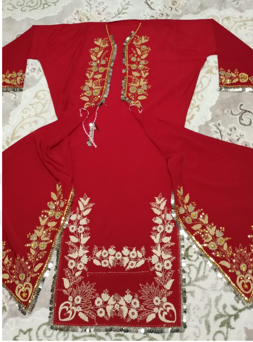
Görsel 22: Deyre

Deyre giyinme sıralamasında könçek ve köynekten sonra giyilmektedir. Önden bel hizasına dikilen bağcık sayesinde önünün kapanması sağlanır. Etek uçları yan kenarlarında olan bağcıklarla, eteğin yan kısımları arkaya doğru bağlanır. Kıyafet boyu ön ve arkada eşit hizadadır. Boyundan ayak bileklerine kadar uzanan giysidir.