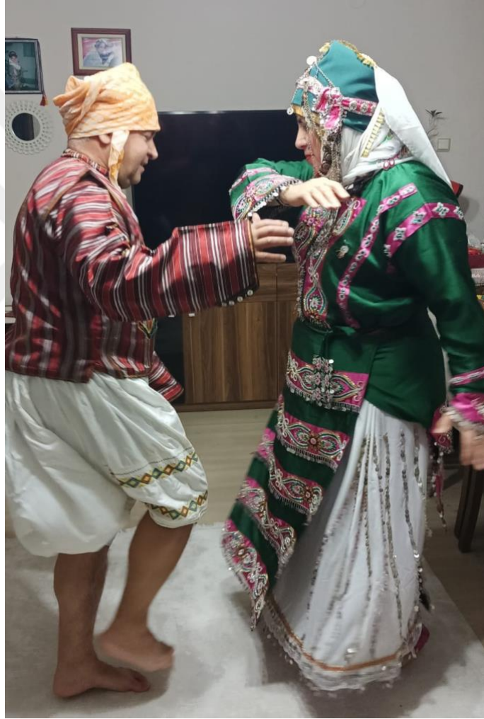
Görsel 6: Semah Dönen Türkmenler

Bismi Şah Allah Allah Allah. Semahlar safola, günahlar def of ola. Semahlarımız kırklar semahı ola. Hizmet gören canların hizmetleri kabul, muratları hâsıl ola. Dil bizden nefes pir Hünkâr Hacı Bektaş'tan ola. Gerçeğin demine Hû mümine ya Ali. Allah eyvallah (K-9, Kişisel Görüşme, 2 Mart 2023).