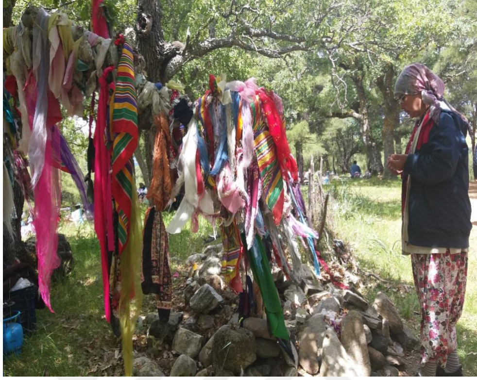
Görsel 9: Düz Dede'de Dua Eden, Dilek Dileyen Kadın