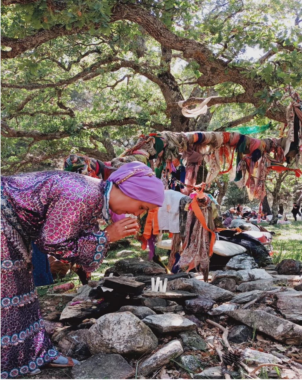
Görsel 7: Niyaz Eden Kadın