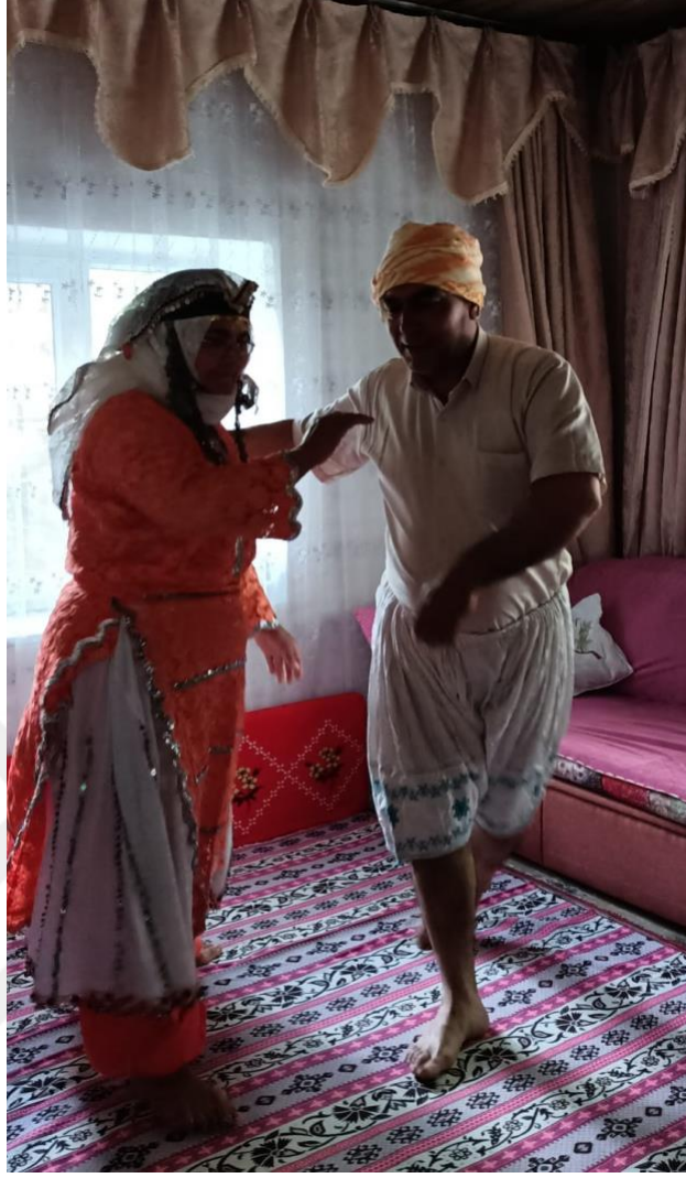
Görsel 5: Semah Döner Çift

Semaha kalkmadan üç nefes okunur. Bu nefeslerden bir tanesi yukarıda örnek olarak verilen nefestir. Üç nefesten sonra üç kez semaha kalkılır. Sazandar sırasıyla semaha kalkacakları beyitlerle çağırır. 1. semah için: