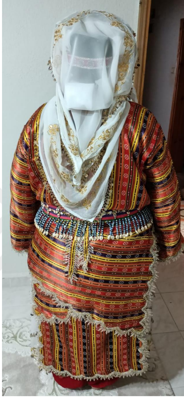
Görsel 19: Tahtacı Türkmen Kıyafeti Arkadan Görünüş