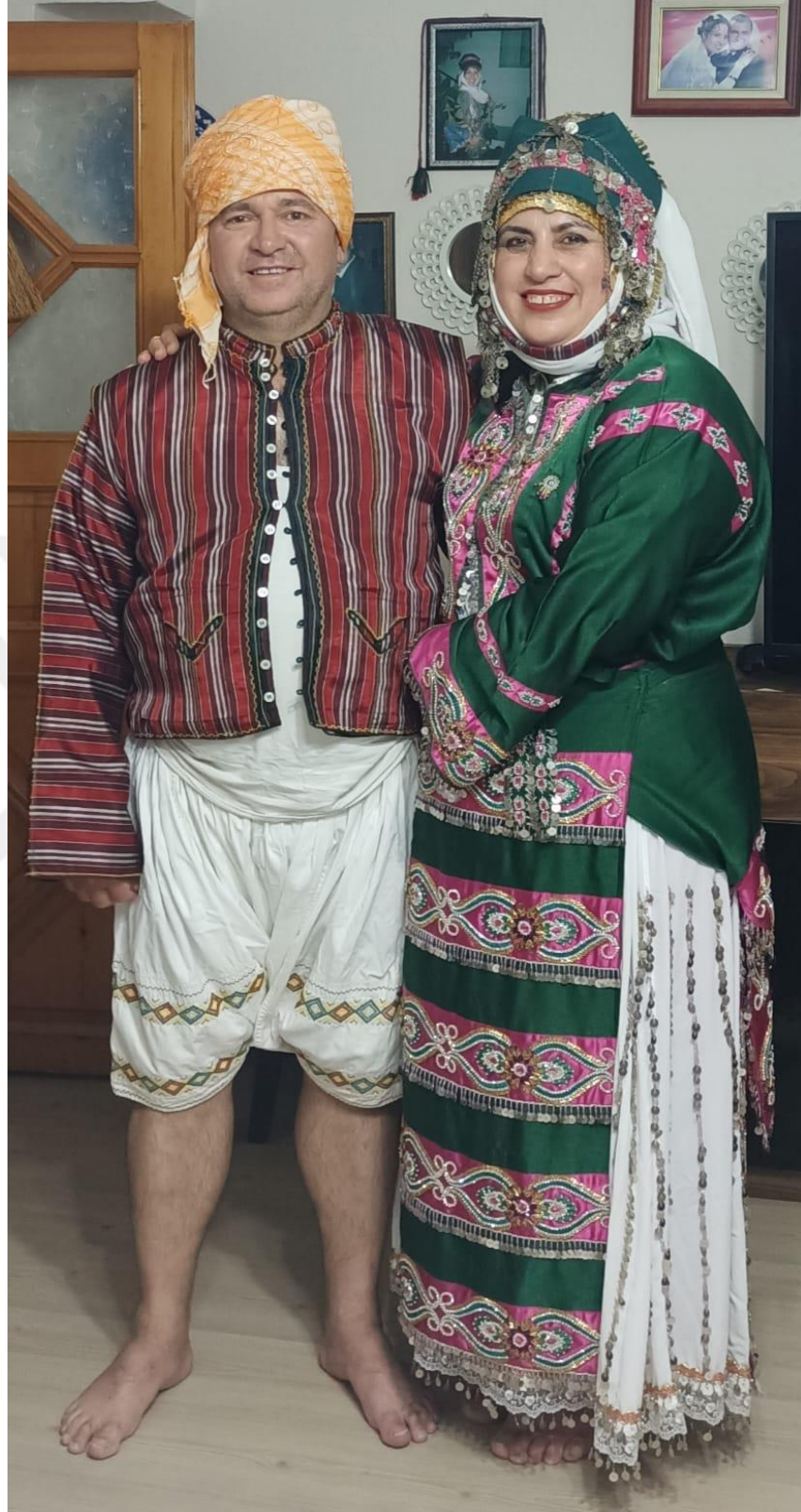
Görsel 33: Erkeklerde Delme Takımı ve Könçeği, Kadınlarda Deyre Örneği