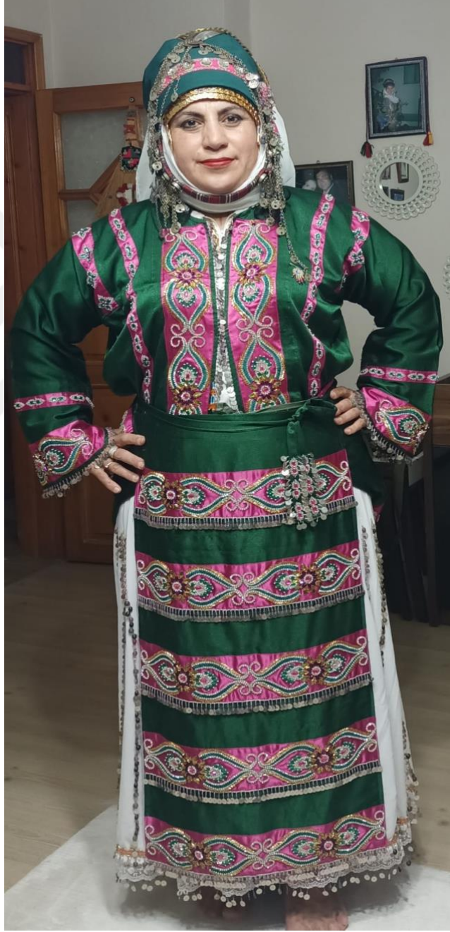
Görsel 26: Evli Kadın Başı

En altta beyaz işlemeli keten, altınlı terlik, düz yeşil ve boncuklu pembe çeki, öndeki de tomakadır. Baş bağlanırken önce aşa altın pullu koşar terlik takılır. Üzerine eşarp şeklinde beyaz renkte keten bağlanır. Alna yeşil veya yeşil-pembe karışımı çeki bağlanır. Tomaka çeneden kulakların üzerine doğru takılır. Baş bağlama sadece evli kadınlara yapılır. Nişanlı olan kadın başlığı altın terlik üzerine, yeşil altınlı çekinin bağlanmasıyla yapılır. Bekâr kızlar herhangi bir başlık takmazlar.