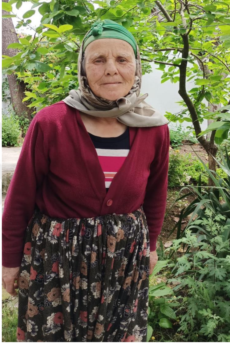
Görsel 31: Büyüklerde Baş Bağlama Örneği

gelin bu şekilde hazırlanarak çıkarılmaktadır. Gelinlik yerine yöresel kıyafetler giyilerek evden çıkma geleneği Koşuburnu Türkmenlerinde devam eden uygulamalar arasındadır.