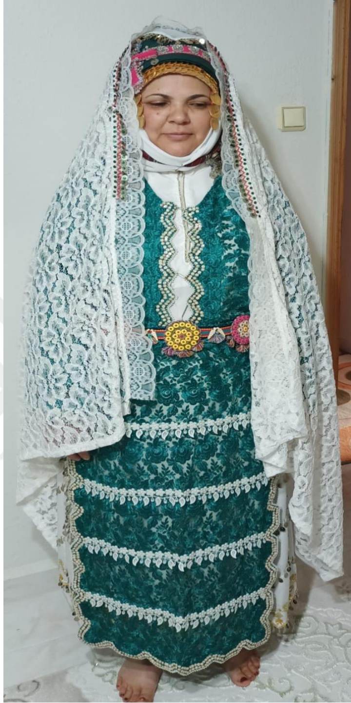
Görsel 28: Tahtacı Geline Duvağı: Bürümbe Önden Görünüm