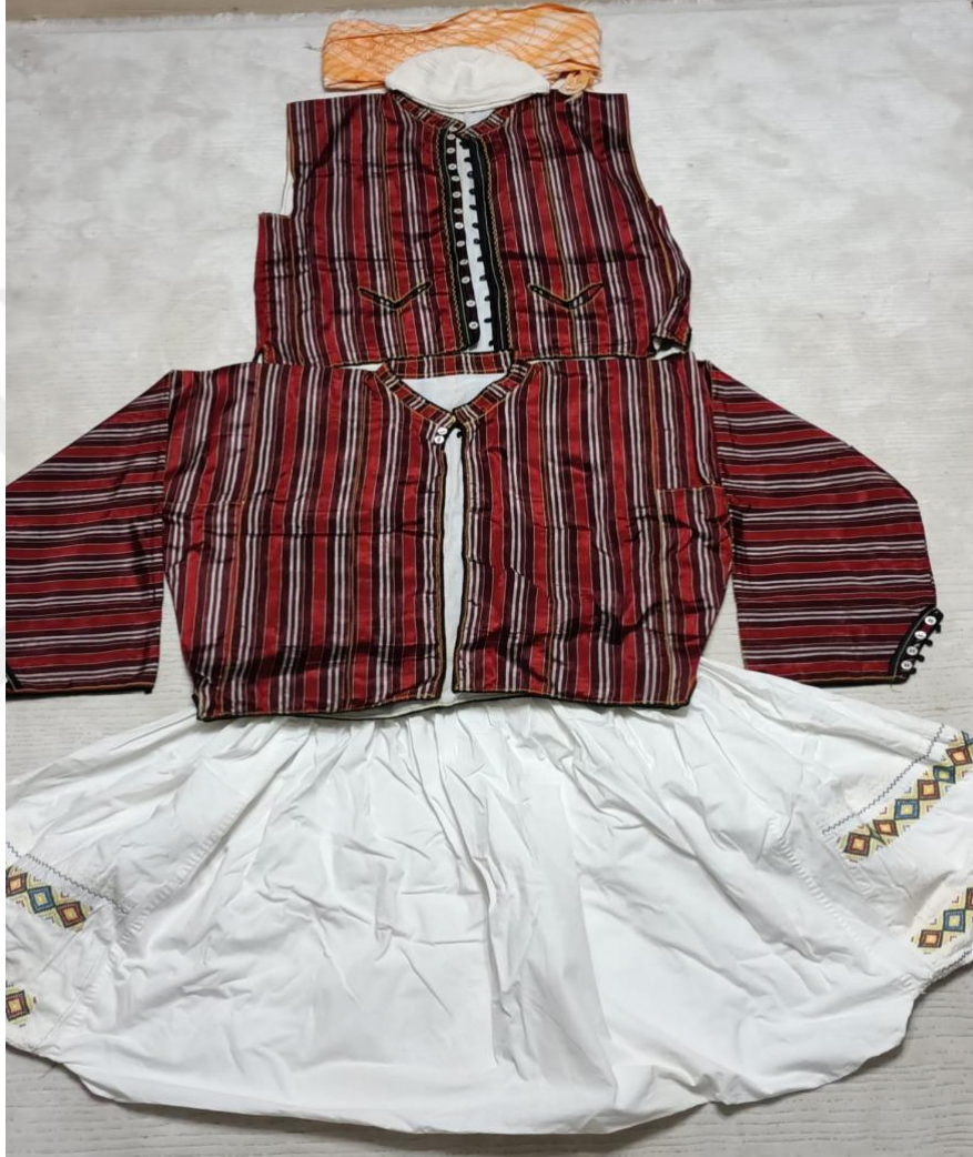
Görsel 32: Erkek Kıyafetleri

Erkek giyimleri kadın giyimine göre daha az parçadan oluşmaktadır. Başa takke giyilir ve sarık dolanır. Üst giyimde “delme takımı” denilen yelek ve gömlekten oluşan iki parçalı kıyafet vardır. Alt giyim olarak da belden dize kadar gelen, beli lastikli ve yanları nakışlı könçek giyilir.