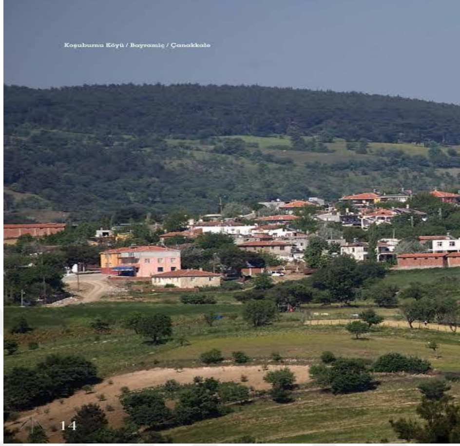
Görsel 1: Koşuburnu Tahtacı Türkmenleri Köyü