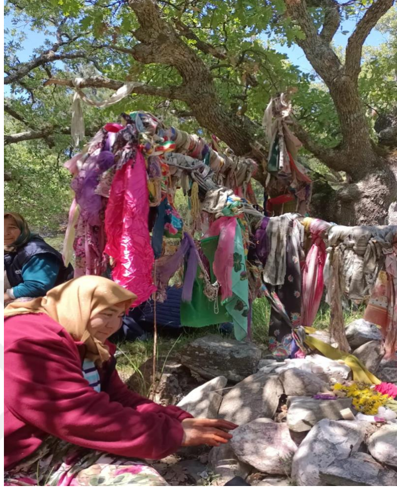
Görsel 8: Niyaz Eden Kadın Örneği