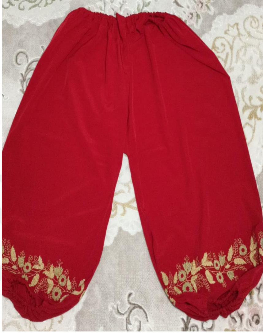
Görsel 21: Könçek

Şalvar şeklinde olan ve köynek altına giyilen alt giysidir. Beli lastikli, ağ kısmı baklava şeklinde geniş, ayak bilekleri içe doğru hafif kıvrılacak şekilde lastiklidir. Sadece ayak kısmı görüldüğü için o kısma nakış veya boncuklar işlenir.