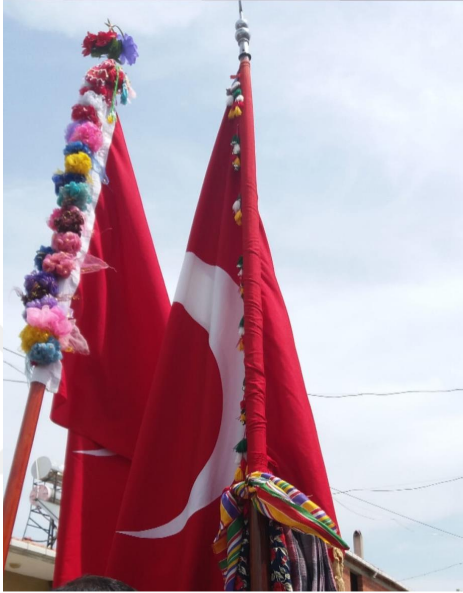
Görsel 16: Kız Evi ve Oğlan Evinin Bayrakları

Kız tarafına getirilen kepez kutsal olduğuna inanıldığı için yüksekçe bir yere asılır. Kepezin düşmemesi gerekir. Aynı şekilde bayrağın da düşmemesi gerekir. Kutsal kabul edildikleri için düşmeleri hoş görülmez ve düşmeleri durumunda horoz kesilir, kan akıtılır. Horoz kesilene kadar yerden kaldırılmazlar. Kepezin kız evine gelmesinden sonra kız annesi kızın büyükleri ağıt ağlarlar. Sonrasında kız evi oğlan tarafına hürmet gösterir, yemekler yenir, oyunlar oynanır. Sonrasında oğlan tarafı kalkar ve kız tarafı oğlan tarafına gider. Çeyiz götürme işlemi gerçekleştirilir. Çeyiz düğünden bir hafta önce serilir fakat düğünde usule uygun olarak birkaç parça çeyiz eşyası, genelde çeyiz sandığı ve çeyiz oğlağı götürülür. Düğün farklı köyler arasındaysa oğlan tarafı kız tarafını köyün girişinde karşılar. Aynı köyde ise karşılama olmadan oğlan evine gidilir. Önce çeyiz oğlağı kesilir. Sonra oğlaklar oğlan