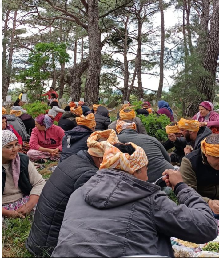
Görsel 12: Sarık Dolanan ve Öbek Halinde Oturan Cemaat