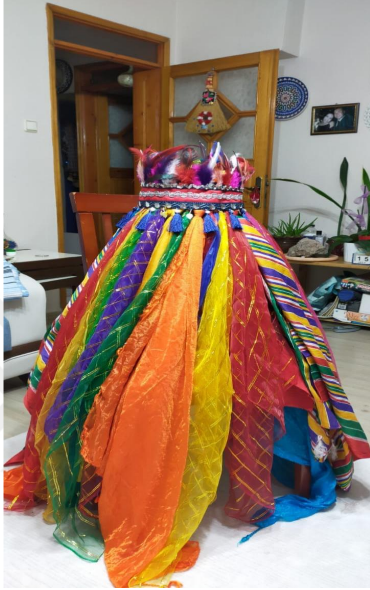
Görsel 14: Kepez Örneđi