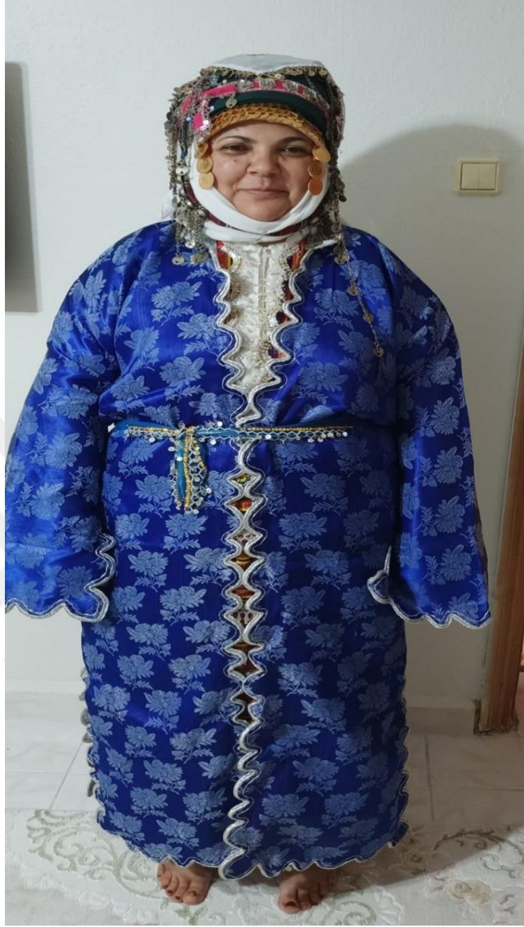
Görsel 30: Giyesi

Giyesi, kepezi oğlan evinden kız evine götürürken kepez giyen kız sağdıcı tarafından giyilerek götürülür. Giyesi aynı zamanda “üç etek” olarak da adlandırılmaktadır. Gök veya allı desenlerde olabilmektedir. Kız evine götürülen giyesi, gelin çıkımında gelinin giydiği Türkmen kıyafetlerinin üzerine giydirilir. Beli kuşak tarafından bağlanır. Bu kuşağı gelinin babası, oğlan kardeşi veya yakın bir erkek akrabası bağlamaktadır. Evden çıkmadan önce