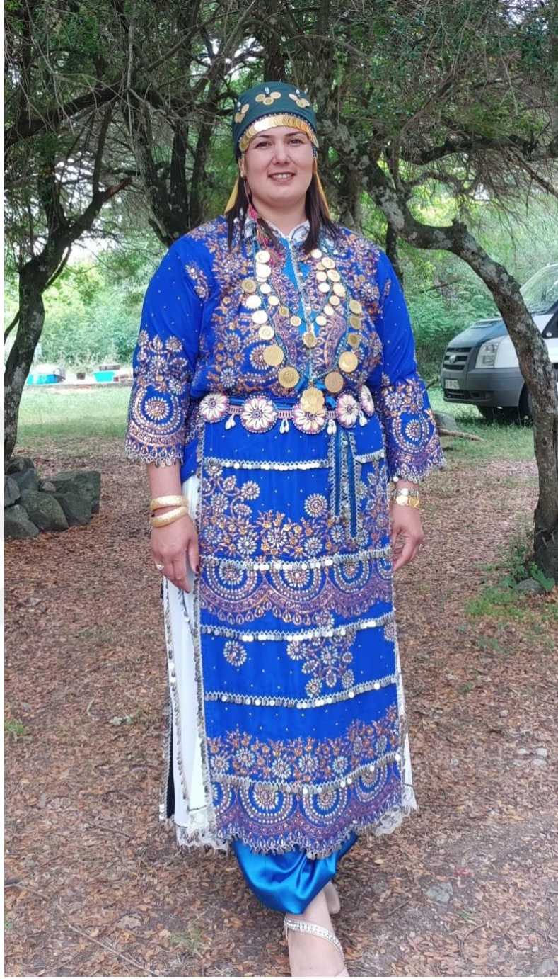
Görsel 27: Nişanlı Gelin Kız Başı