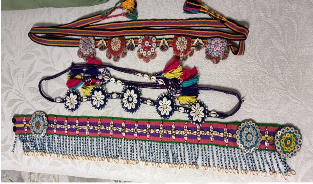
Görsel 24: Çeşitli Şekil ve Desenli Kemerler