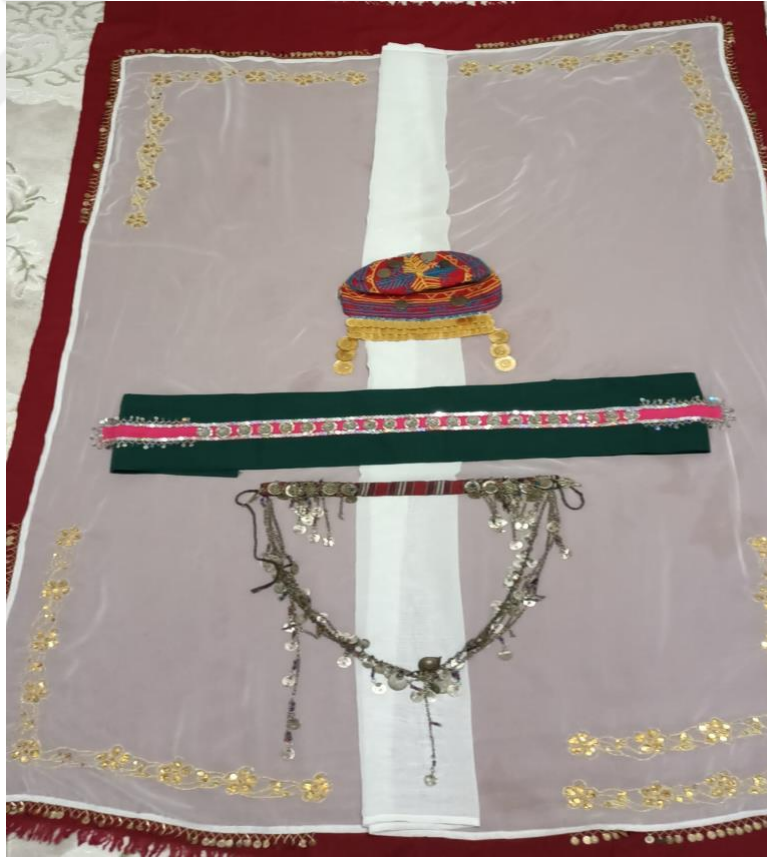
Görsel 25: Baş Bağlamada Kullanılan Kıyafetler