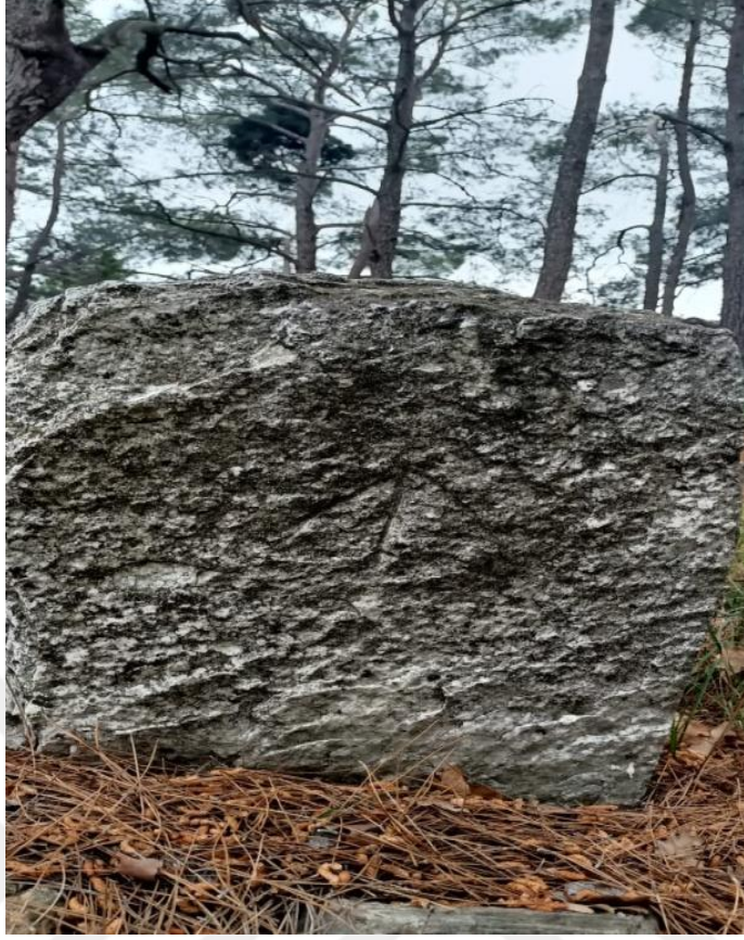
Görsel 2: Koşuburnu Köyü Mezarlığında Bir Kazayağı Sembolü

Görüşmecilerimizden dinlediğimiz “Tahtacılığın Tanımı” adlı şiir: Adem’den beri gelir soyumuz Üç oklu Türkmen’dir boyumuz İnancımı sorarsan be dost. İmam Cafer’in yoludur yolumuz