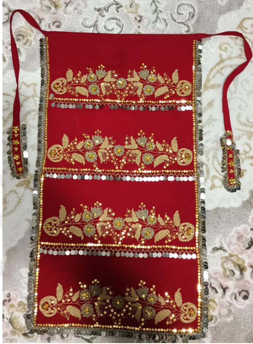
Görsel 23: Önlük

Deyreden sonra öne belden bağlanan ve ayak bileklerine kadar uzanan giysidir. Önlük bağlandıktan sonra bele kemer takılır. Kıyafet giyimleri tamamlanmış olur. Sonrasında baş için ayrı parçalar kullanılır.