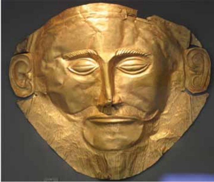
Resim 1 Agamemnon'un altın maski