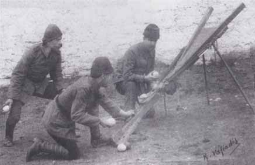
Resim 5 Savaşta Türk ordusunun kullandığı mancınk