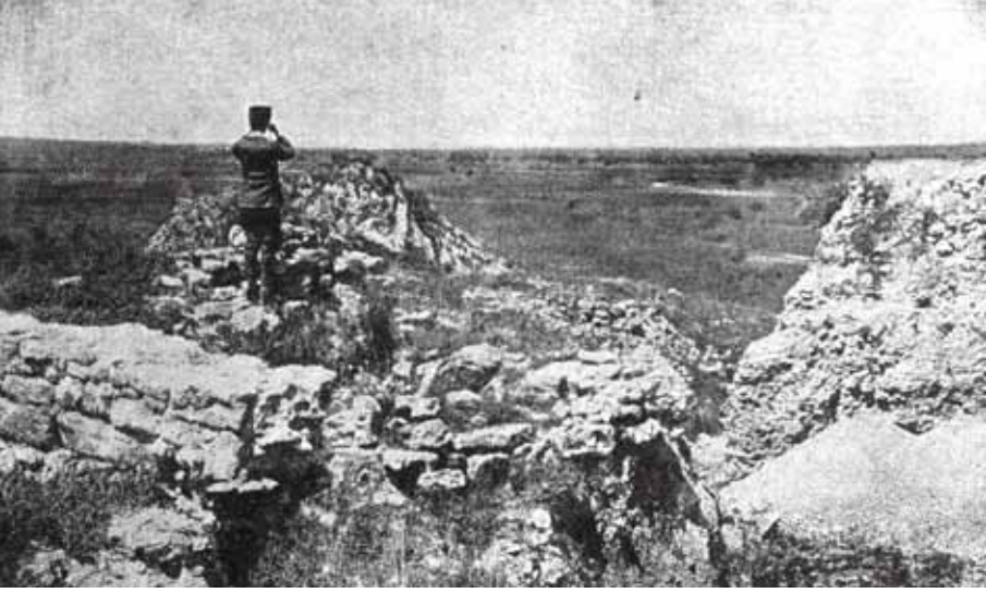
Resim 6 Troia'dan Ege denizine bakan bir Türk Subayı