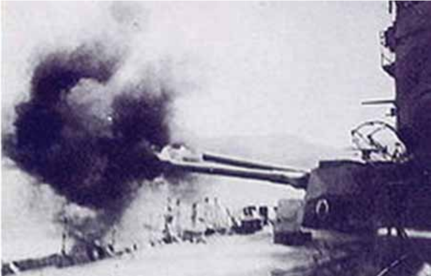
Resim 15 Agamemnon'un Troia'ya doğru top atışları