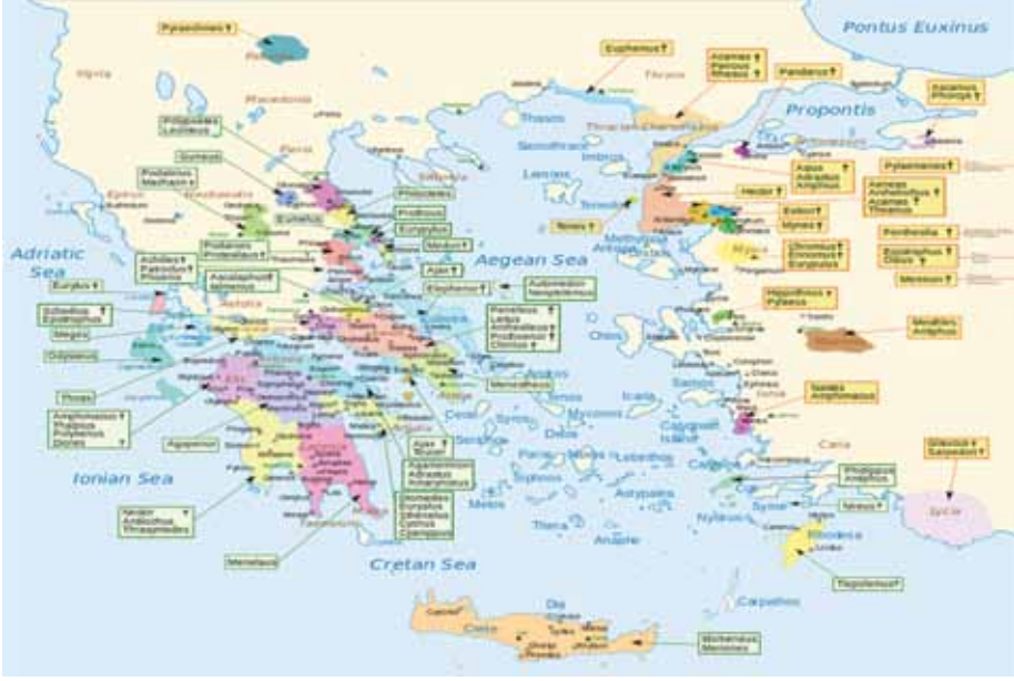
Harita 3 Troia savařına katılan uluslar