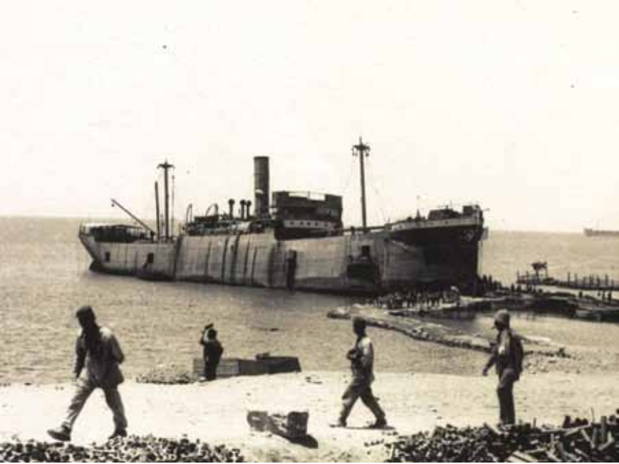
Resim 13 Çanakkale Savaşı'nın Truva Atı, River Cylide