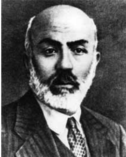
Resim 17 Mehmet Akif Ersoy