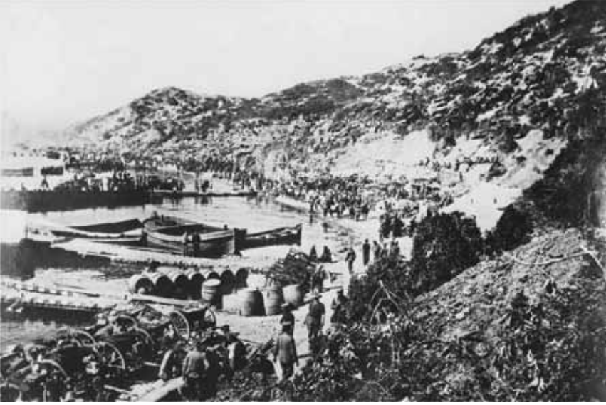
Resim 2 Çanakkale Savaşları sırasında Anzak Koyu