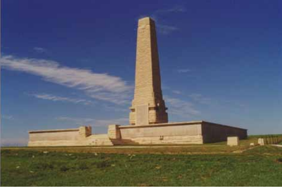
Resim 8 Seddülbahir yakınındaki Helles anıtı (Sestos Projesi)