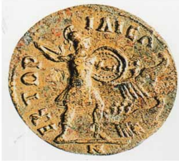
Resim 4 “M.S. 3. Yüzyıl Troia sikkesi üzerinde Akhalara saldırırken betimlenen Troia kahramanı Hektor