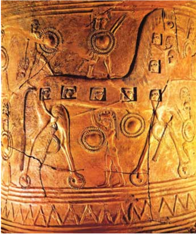
Resim 11 Antik vazo üzerinde Truva Atının tasviri