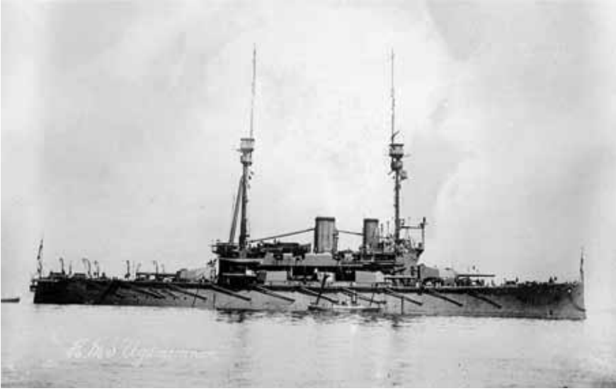
Resim 14 HMS Agamemnon