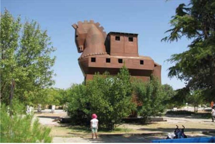
Resim 12 Truva Atı (Troia Projesi)