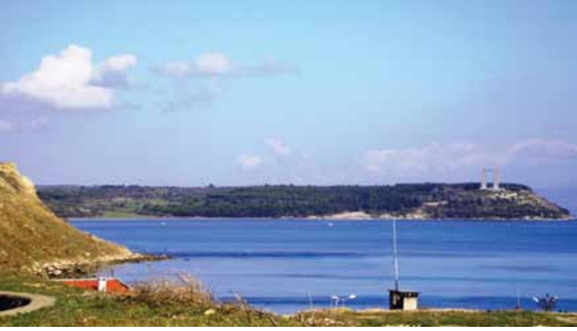
Resim 10 Çanakkale savaşının Aşil Topoğu (Sestos Projesi)