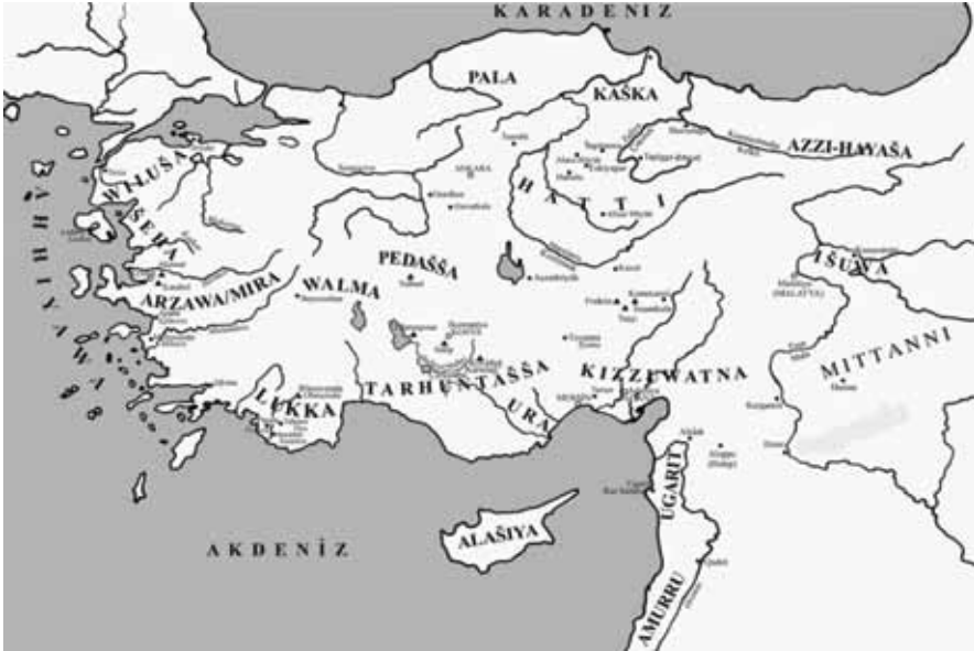
Harita 2 M. Ö. 2. Bin Hititler ve komşuları