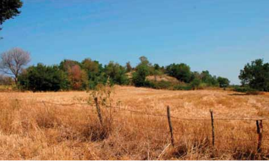
Resim 7 Seddülbahir yakınındaki Protesilaos tümülüsü (Sestos Projesi)