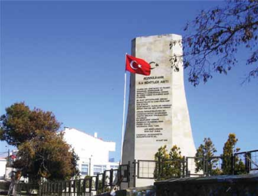
Resim 9 Seddülbahir köyü içindeki ilk şehitler anıtı (Sestos Projesi)